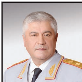
МИНИСТР ВНУТРЕННИХ ДЕЛ РОССИЙСКОЙ ФЕДЕРАЦИИ ГЕНЕРАЛ ПОЛИЦИИ РОССИЙСКОЙ ФЕДЕРАЦИИ Владимир Александрович Колокольцев