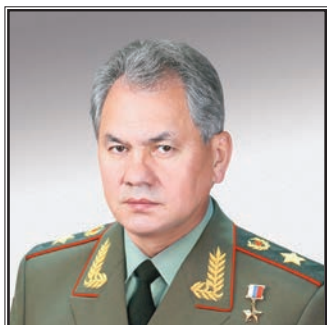
МИНИСТР ОБОРОНЫ РОССИЙСКОЙ ФЕДЕРАЦИИ ГЕНЕРАЛ АРМИИ Сергей Кужугетович Шойгу