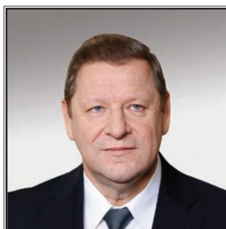
ЧЛЕН КОЛЛЕГИИ (МИНИСТР) ПО ПРОМЫШЛЕННОСТИ И АГРОПРОМЫШЛЕННОМУ КОМПЛЕКСУ ЕВРАЗИЙСКОЙ ЭКОНОМИЧЕСКОЙ КОМИССИИ Сергей Сергеевич Сидорский