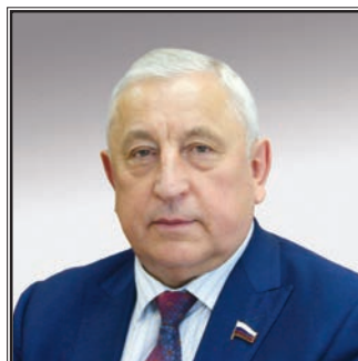
ПРЕДСЕДАТЕЛЬ КОМИТЕТА ГОСУДАРСТВЕННОЙ ДУМЫ ПО РЕГИОНАЛЬНОЙ ПОЛИТИКЕ И ПРОБЛЕМАМ СЕВЕРА И ДАЛЬНЕГО ВОСТОКА Николай Михайлович Харитонов