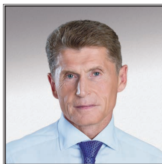
ГУБЕРНАТОР САХАЛИНСКОЙ ОБЛАСТИ Олег Николаевич Кожемяко