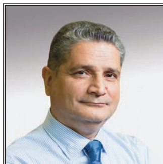
ПРЕДСЕДАТЕЛЬ КОЛЛЕГИИ ЕВРАЗИЙСКОЙ ЭКОНОМИЧЕСКОЙ КОМИССИИ Тигран Суренович Саркисян