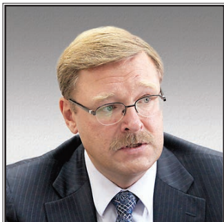
ПРЕДСЕДАТЕЛЬ КОМИТЕТА СОВЕТА ФЕДЕРАЦИИ ПО МЕЖДУНАРОДНЫМ ДЕЛАМ Константин Иосифович Косачев