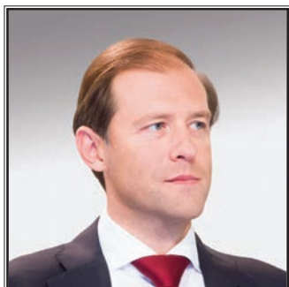
МИНИСТР ПРОМЫШЛЕННОСТИ И ТОРГОВЛИ РОССИЙСКОЙ ФЕДЕРАЦИИ Денис Валентинович Мантуров