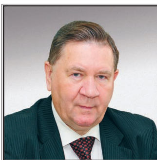
ГУБЕРНАТОР КУРСКОЙ ОБЛАСТИ Александр Николаевич Михайлов