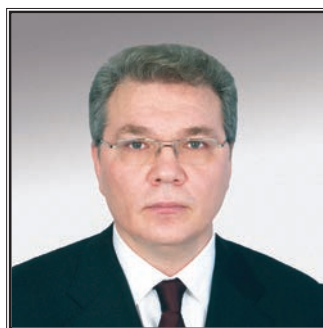
ПРЕДСЕДАТЕЛЬ КОМИТЕТА ГОСУДАРСТВЕННОЙ ДУМЫ ПО ДЕЛАМ СОДРУЖЕСТВА НЕЗАВИСИМЫХ ГОСУДАРСТВ, ЕВРАЗИЙСКОЙ ИНТЕГРАЦИИ И СВЯЗЯМ С СООТЕЧЕСТВЕННИКАМИ Леонид Иванович Калашников