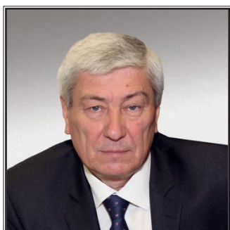
ДИРЕКТОР ФЕДЕРАЛЬНОЙ СЛУЖБЫ ПО ФИНАНСОВОМУ МОНИТОРИНГУ Юрий Анатольевич Чиханчин