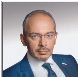
ПРЕДСЕДАТЕЛЬ КОМИТЕТА ГОСУДАРСТВЕННОЙ ДУМЫ ПО ПРИРОДНЫМ РЕСУРСАМ, СОБСТВЕННОСТИ И ЗЕМЕЛЬНЫМ ОТНОШЕНИЯМ Николай Петрович Николаев