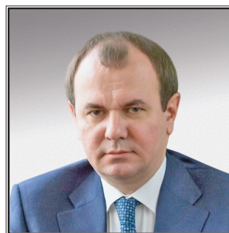
СТАТС-СЕКРЕТАРЬ – ЗАМЕСТИТЕЛЬ МИНИСТРА СЕЛЬСКОГО ХОЗЯЙСТВА РОССИЙСКОЙ ФЕДЕРАЦИИ Иван Вячеславович Лебедев