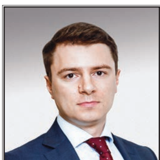
ДИРЕКТОР ДЕПАРТАМЕНТА СТАНКОСТРОЕНИЯ И ИНВЕСТИЦИОННОГО МАШИНОСТРОЕНИЯ МИНИСТЕРСТВА ПРОМЫШЛЕННОСТИ И ТОРГОВЛИ РОССИЙСКОЙ ФЕДЕРАЦИИ Михаил Игоревич Иванов