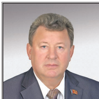
ПРЕДСЕДАТЕЛЬ КОМИТЕТА ГОСУДАРСТВЕННОЙ ДУМЫ ПО АГРАРНЫМ ВОПРОСАМ АКАДЕМИК РАН Владимир Иванович Кашин