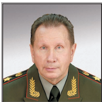
ДИРЕКТОР ФЕДЕРАЛЬНОЙ СЛУЖБЫ ВОЙСК НАЦИОНАЛЬНОЙ ГВАРДИИ РОССИЙСКОЙ ФЕДЕРАЦИИ – главнокомандующий войсками национальной гвардии Российской Федерации ГЕНЕРАЛ АРМИИ Виктор Васильевич Золотов