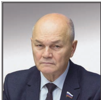
ПРЕДСЕДАТЕЛЬ КОМИТЕТА СОВЕТА ФЕДЕРАЦИИ ПО АГРАРНО- ПРОДОВОЛЬСТВЕННОЙ ПОЛИТИКЕ И ПРИРОДО- ПОЛЬЗОВАНИЮ Михаил Павлович Щетинин