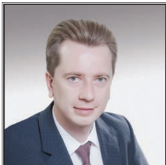
ПРЕДСЕДАТЕЛЬ КОМИТЕТА ГОСУДАРСТВЕННОЙ ДУМЫ ПО ЭКОЛОГИИ И ОХРАНЕ ОКРУЖАЮЩЕЙ СРЕДЫ Владимир Владимирович Бурматов