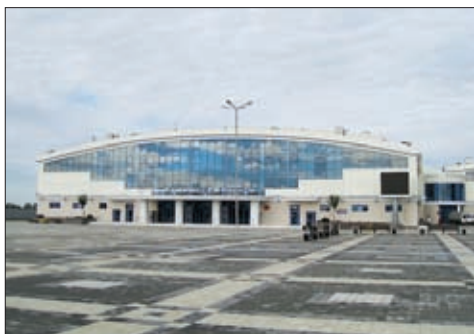
ЛЕДОВЫЙ ДВОРЕЦ ICE PALACE