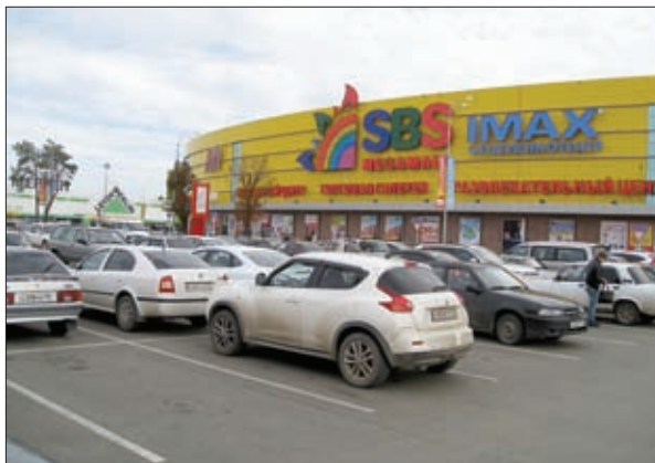
ТРК «СБС МЕГАМОЛЛ»

именно на этом этапе. Решения, закладываемые в проекты планировки и генеральные планы муниципальных образований, – это именно та стадия, на которой возможно градостроительное регулирование.