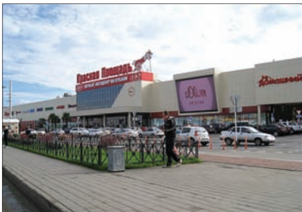
ТРК «КРАСНАЯ ПЛОЩАДЬ»