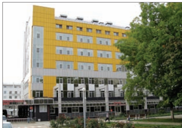
КРАЕВАЯ КЛИНИЧЕСКАЯ БОЛЬНИЦА №1 ИМЕНИ С.В. ОЧАПОВСКОГО

ре деятельности, вносит вклад в реализацию национальных проектов и региональных программ на территории края. В организации работают 38 аттестованных экспертов. Среди них 4 кандидата наук, 3 почетных архитектора России, 1 почетный строитель России, 4 почетных строителя Южного федерального округа, 2 заслуженных архитектора Кубани, 1 заслуженный экономист Кубани. ГАУ КК «Краснодаркрайгосэкспертиза» внесено в энциклопедию «Выдающиеся предприятия России».