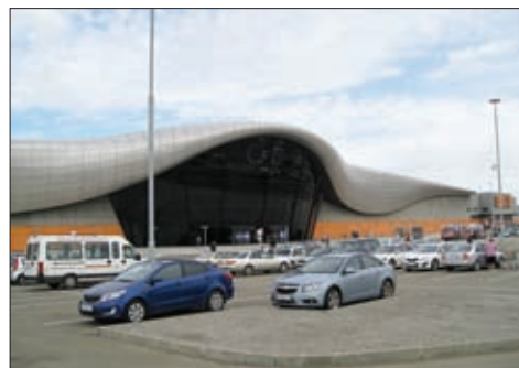
ТРК OZ MALL