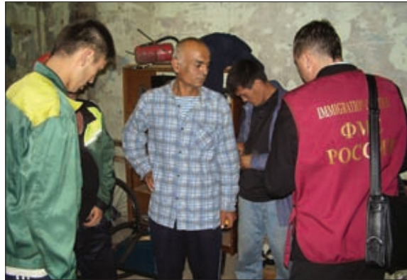
ПРОВЕРКА ДОКУМЕНТОВ У МИГРАНТОВ, ПОСЕЛИВШИХСЯ В НЕЖИЛОМ ПОМЕЩЕНИИ

Между тем вопросы миграции оказались в центре внимания всего общества. Важность этого обстоятельства отразилась в выступлении В.В. Путина на расширенном заседании коллегии ФМС России 26 января 2012 года.