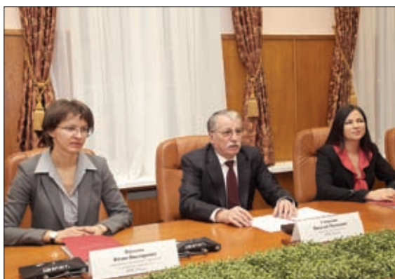
СОВЕЩАНИЕ ПО ВОПРОСАМ РЕАДМИССИИ

В 1996 году принят Федеральный закон «О порядке выезда из Российской Федерации и въезда в Российскую Федерацию».