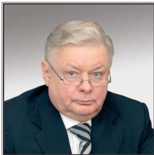
РУКОВОДИТЕЛЬ ФЕДЕРАЛЬНОЙ МИГРАЦИОННОЙ СЛУЖБЫ Константин Олегович Ромодановский

Во времена СССР государство управляло, по сути, только процессами внутренней миграции – в частности, через институты прописки и организованного набора рабочей силы. Внешней миграции и, соответственно, государственной миграционной политики в современном виде не существовало.