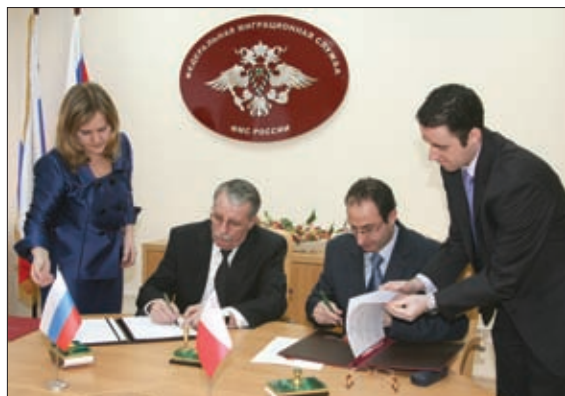
ЗАМЕСТИТЕЛЬ РУКОВОДИТЕЛЯ ФМС РОССИИ Н.М. СМОРОДИН ПОДПИСЫВАЕТ СОГЛАШЕНИЕ О РЕАДМИССИИ С ПОЛЬШЕЙ

щих закона от 19 февраля 1993 года – Федеральный закон №4528-1 «О беженцах» и Закон Российской Федерации №4530-1 «О вынужденных переселенцах».