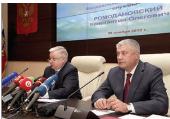
К.О. РОМОДАНОВСКИЙ И В.А. КОЛОКОЛЬЦЕВ НА СОВМЕСТНОЙ КОЛЛЕГИИ ФМС РОССИИ И МВД РОССИИ