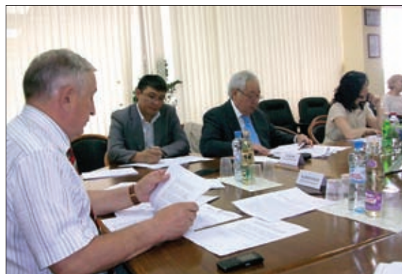
ОБСУЖДЕНИЕ ПРОЕКТА ФЕДЕРАЛЬНОГО ЗАКОНА «О СОЦИАЛЬНО-ЭКОНОМИЧЕСКОМ РАЗВИТИИ ДАЛЬНЕГО ВОСТОКА И БАЙКАЛЬСКОГО РЕГИОНА»

По мнению комитета, в проекте закона необходимо отразить способы закрепления молодого поколения на территории Дальневосточного региона для развития его трудового потенциала. В частности, есть в проекте закона несколько статей, касающихся ученического договора и льготного поступления в вузы на территории Дальневосточного федерального округа при условии работы на протяжении определенного периода на территории того же округа. Но нам представляется, что стимулирующим будет принятие такой меры, как освобождение от ЕГЭ на территории Дальневосточного федерального округа, поскольку уже сейчас пропускная способность Дальневосточного федерального университета позволяет принимать всех выпускников школ без экзаменов. Определенным этапом, фильтром на успеваемость конечно же должна стать экзаменационная сессия. Безусловно, в этих поправках нет никакой благотворительности.