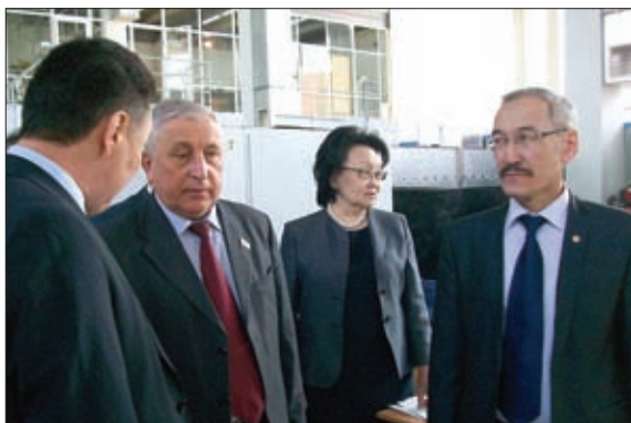
С УЧАСТНИКАМИ ВЫЕЗДНОГО ЗАСЕДАНИЯ КОМИТЕТА В РЕСПУБЛИКЕ САХА (ЯКУТИЯ)