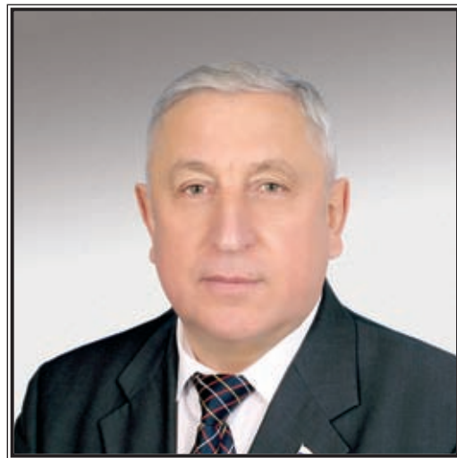
ПРЕДСЕДАТЕЛЬ КОМИТЕТА ГОСУДАРСТВЕННОЙ ДУМЫ ПО РЕГИОНАЛЬНОЙ ПОЛИТИКЕ И ПРОБЛЕМАМ СЕВЕРА И ДАЛЬНЕГО ВОСТОКА Николай Михайлович Харитонов

Природный ресурсный и транзитный потенциал Дальнего Востока предоставляет России широкие возможности стать в перспективе одним из лидеров глобальной экономики, а уже сегодня активным участником динамично развивающегося Азиатско-Тихоокеанского региона. На огромной дальневосточной территории, превышающей площадь всей Европы, сосредоточены богатейшие ресурсы, с освоением и использованием которых связаны планы долгосрочного экономического роста и процветания страны, улучшения жизни наших граждан.