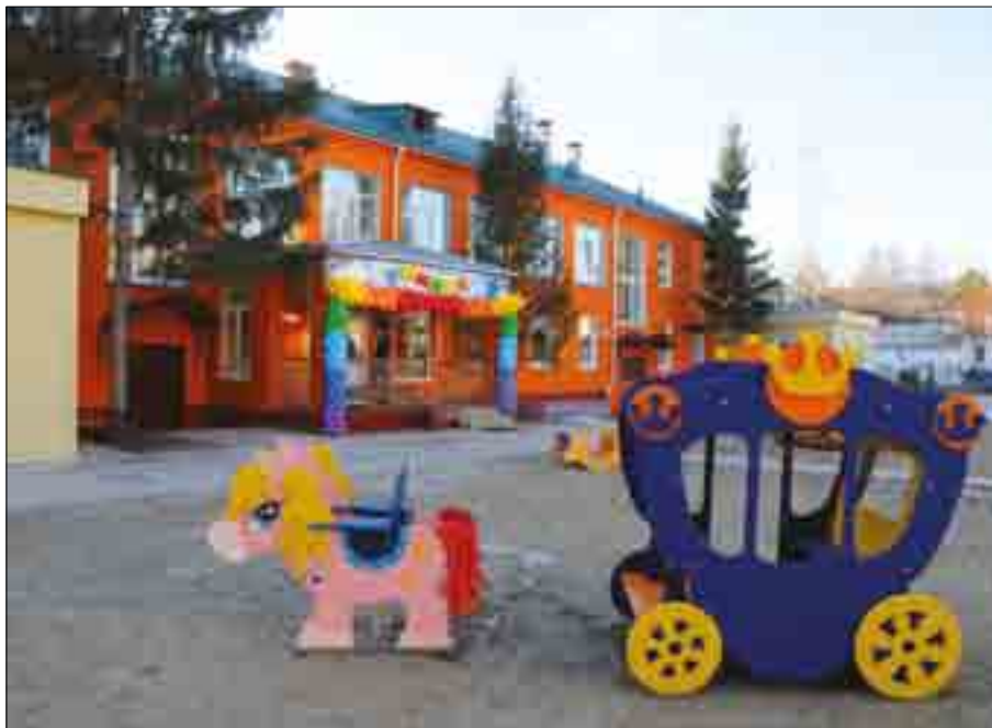
ПЕРВЫЙ В ОМСКОЙ ОБЛАСТИ ЧАСТНЫЙ ДЕТСКИЙ САД «УМНИЦА» ОТКРЫЛСЯ ПРИ ПОДДЕРЖКЕ ОБЛАСТНОГО БЮДЖЕТА

Кроме того, принята программа по обеспечению продовольственной безопасности на 2010–2011 годы. Особое внимание в ней уделено развитию альтернативных форм торговли. Наряду со строительством современных торговых комплексов необходимо расширять число торговых точек для сельских товаропроизводителей, где фермеры, владельцы личных подсобных хозяйств могли бы реализовывать продукцию собственного производства напрямую, минуя посредническое звено.