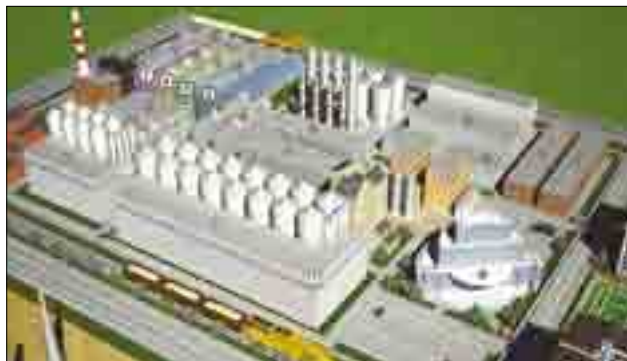
ПРОЕКТ БИОКОМПЛЕКСА – ОДНОГО ИЗ ОСНОВНЫХ ОБЪЕКТОВ НОВОЙ ИНДУСТРИАЛЬНОЙ ПЛАТФОРМЫ ОМСКОЙ ОБЛАСТИ

ваты из льноволокна. На Омском нефтеперерабатывающем заводе запущена установка изомеризации легких бензиновых фракций производительностью порядка 1 млн. т в год – крупнейшая не только в России, но и в Европе. В Калачинском районе запущена линия по производству декоративного облицовочного кирпича мощностью 35 млн. штук в год, в Тарском районе – деревообрабатывающий комплекс полного цикла с глубокой переработкой древесины, рассчитанный на выпуск до 10 тыс. куб. м шпона лушеного и 8 тыс. куб. м фанеры в год. В районах Омской области также введены крупные заводы и модульные молокоперерабатывающие мини-заводы. На завершающей стадии строительство полипропиленового завода, первые производства агропромышленного кластера, рапсовый завод.