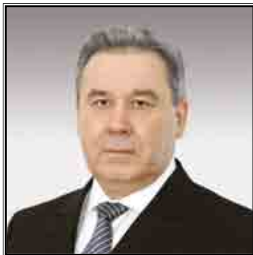
ГУБЕРНАТОР ОМСКОЙ ОБЛАСТИ Леонид Константинович Полежаев

Создание условий для инновационного развития промышленности, малого бизнеса, эффективной системы государственного управления, обеспечение социальных гарантий, общественной безопасности, поддержка на достойном уровне культурных и спортивных достижений – основные задачи, которые постоянно ставятся перед органами исполнительной власти Омской области. По прогнозам, к 2015 году экономика области должна вырасти более чем в 1,5 раза к уровню 2010 года. В значительной мере основу такой динамики составят три фактора: промышленный рост, инвестиции и увеличение объемов потребления населения за счет повышения уровня благосостояния.