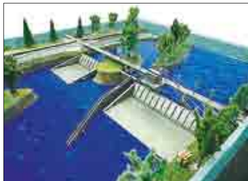
МАКЕТ НИЗКОНАПОРНОГО ГИДРОУЗЛА НА Р. ИРТЫШ