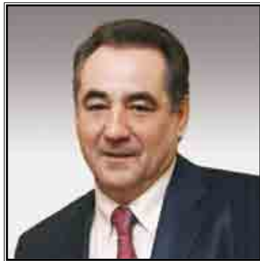
ГУБЕРНАТОР КУРГАНСКОЙ ОБЛАСТИ Олег Алексеевич Богомолов