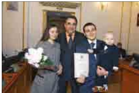
МОЛОДАЯ СЕМЬЯ – УЧАСТНИКИ ИПОТЕЧНОЙ ПРОГРАММЫ

вторая ТЭЦ. Ввод станции, намеченный на 2011 год, должен решить проблемы энергобезопасности г. Кургана и дефицита электроэнергии в регионе. Этот проект был признан лучшим инвестиционным проектом в Уральском федеральном округе в 2009 году, его стоимость составила 12,5 млрд. рублей.