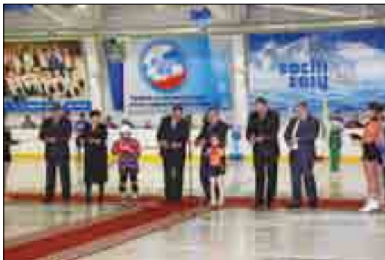
ОТКРЫТИЕ ЛЕДОВОЙ АРЕНЫ «ЮНОСТЬ»

Третье направление, которое предстоит развивать в русле Стратегии, – добыча полезных ископаемых на территории Курганской области.