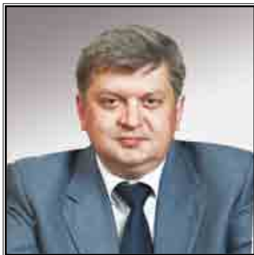
РУКОВОДИТЕЛЬ ФЕДЕРАЛЬНОЙ СЛУЖБЫ ГОСУДАРСТВЕННОЙ СТАТИСТИКИ Александр Евгеньевич Суринов

В октябре 2010 года проведена Всероссийская перепись населения. Многие средства массовой информации назвали перепись одним из важнейших событий года. Согласно мониторингу международной информационной компании Integrum World Wide, осуществляющей мониторинг российских массмедиа, Всероссийской переписи населения 2010 года было посвящено 29,7 тыс. публикаций. По количеству публикаций тема переписи уступила лишь теме проекта «Сколково» (30,6 тыс. публикаций).