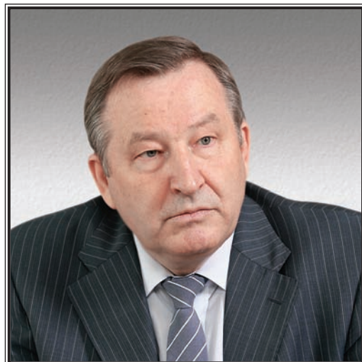
ГУБЕРНАТОР АЛТАЙСКОГО КРАЯ Александр Богданович Карлин

Алтайский край образован в соответствии с постановлением ЦИК СССР от 28 сентября 1937 года делением Западно-Сибирского края на Новосибирскую область и Алтайский край.