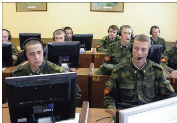
ИЗУЧЕНИЕ ИНОСТРАННЫХ ЯЗЫКОВ – ВАЖНЫЙ ЭТАП В ПОДГОТОВКЕ ВОЕННЫХ СПЕЦИАЛИСТОВ