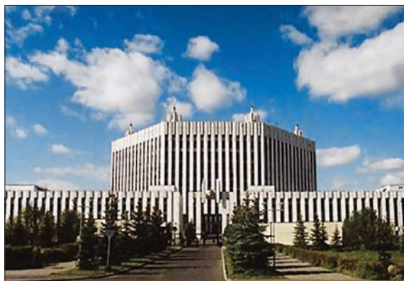
ВОЕННАЯ АКАДЕМИЯ ГЕНЕРАЛЬНОГО ШТАБА ВООРУЖЕННЫХ СИЛ РОССИЙСКОЙ ФЕДЕРАЦИИ