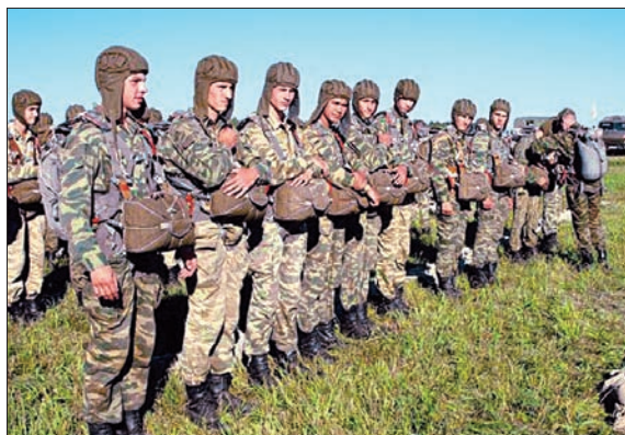
КУРСАНТЫ НОВОСИБИРСКОГО ВЫСШЕГО ВОЕННОГО КОМАНДНОГО УЧИЛИЩА ПЕРЕД ПЕРВЫМ ПРЫЖКОМ С ПАРАШЮТОМ