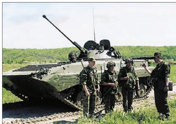
ПОСТАНОВКА УЧЕБНО-БОЕВОЙ ЗАДАЧИ ЭКИПАЖУ БМП НА ВЕДЕНИЕ РАЗВЕДКИ

готовки военнослужащих по широкому спектру специальностей с различными уровнями образования в системообразующих вузах, интеграции образовательного процесса и научных исследований.