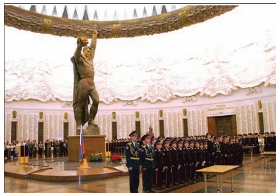
ПОСВЯЩЕНИЕ В СУВОРОВЦЫ ВОСПИТАННИКОВ МОСКОВСКОГО СУВОРОВСКОГО ВОЕННОГО УЧИЛИЩА НА ПОКЛОННОЙ ГОРЕ

дение свободного выхода из военно-учебного заведения после окончания плановых занятий. У курсантов и слушателей появилась возможность посещать библиотеки, культурные центры, выставки.