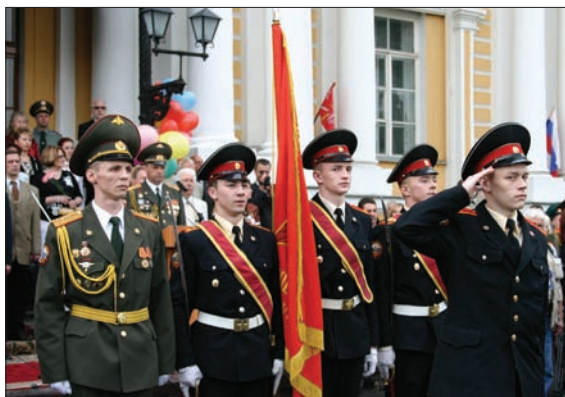
ТРАДИЦИЯМ ОТЦОВ И ДЕДОВ – ВЕРНЫ!