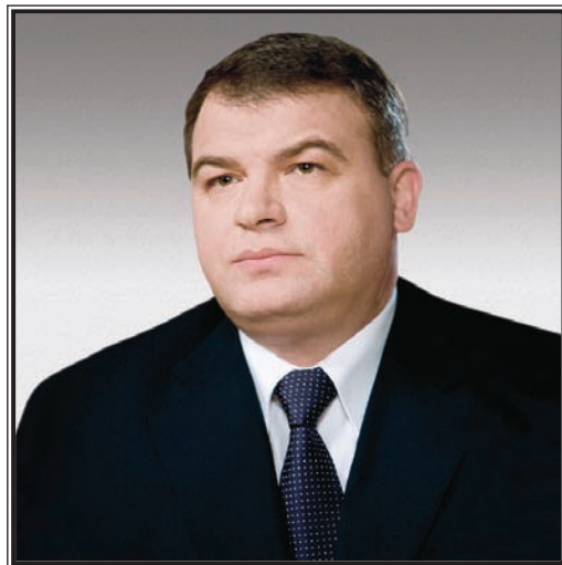
МИНИСТР ОБОРОНЫ РОССИЙСКОЙ ФЕДЕРАЦИИ Анатолий Эдуардович Сердюков

Система военного образования является инструментом формирования кадрового потенциала Вооруженных Сил РФ. Сегодня она играет ведущую роль в обучении, профессиональной переподготовке и повышении квалификации военнослужащих, воспроизводстве педагогических и научных кадров. Ее значимость должна сохраниться и в будущем. Именно поэтому повышение эффективности системы военного образования Военной доктриной Российской Федерации отнесено к основным приоритетам развития военной организации государства.