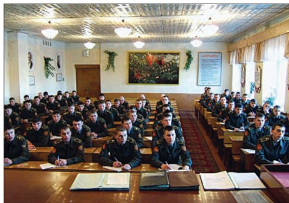
КУРСАНТЫ ДАЛЬНЕВОСТОЧНОГО ВЫСШЕГО ВОЕННОГО КОМАНДНОГО УЧИЛИЩА НА ЛЕКЦИИ ПО ВОЕННОЙ ИСТОРИИ

шие потери в результате распада СССР, приведение деятельности военно-учебных заведений в соответствие с новым законодательством в области военной службы и профессионального образования.