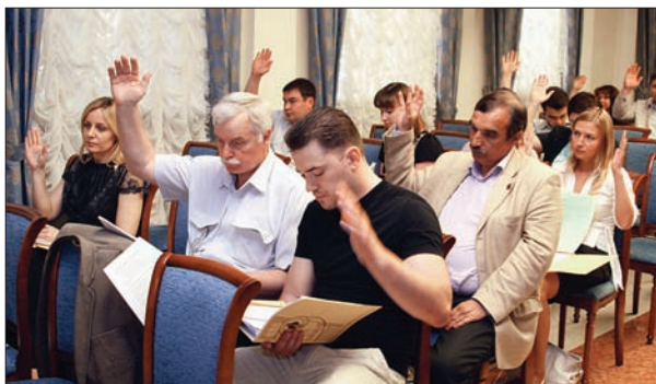
ЗАЛ – ГОЛОСОВАНИЕ НА ОБЩЕМ СОБРАНИИ ЧЛЕНОВ ПАРТНЕРСТВА