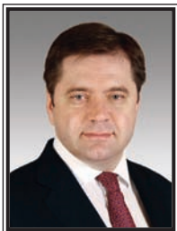
Сергей Иванович Шматко МИНИСТР ЭНЕРГЕТИКИ РОССИЙСКОЙ ФЕДЕРАЦИИ

Россия – страна с богатейшим природно-ресурсным потенциалом, и наша с вами задача сохранить и приумножить ее богатства.