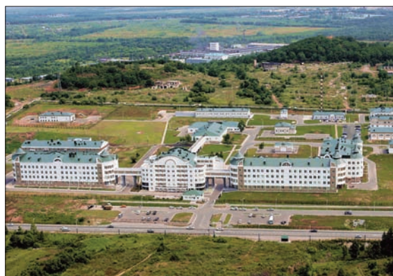
КРАЕВОЙ ОНКОЛОГИЧЕСКИЙ ЦЕНТР

Начинается реализация нового направления приоритетного национального проекта «Здоровье» – обследование населения на выявление туберкулеза, лечение и профилактические мероприятия. С 2010 года край включен в перечень субъектов Российской Федерации, реализующих мероприятия, направленные на совершенствование организации медицинской помощи пострадавшим при дорожно-транспортных происшествиях.