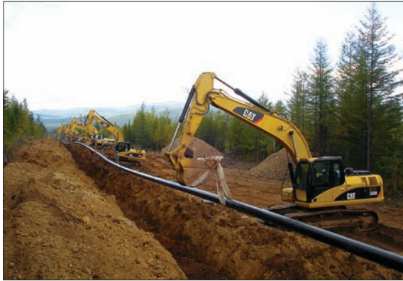
ГАЗОПРОВОД КОМСОМОЛЬСК-НА-АМУРЕ – ХАБАРОВСК