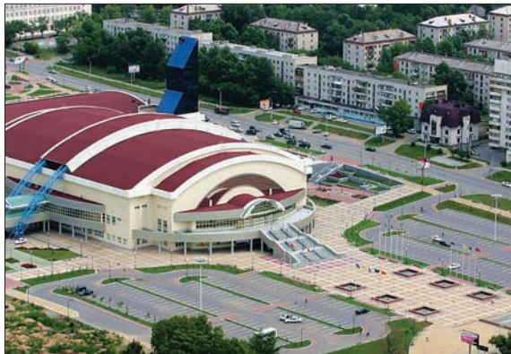
СПОРТИВНО-ЗРЕЛИЩНЫЙ КОМПЛЕКС «ПЛАТИНИУМ АРЕНА»