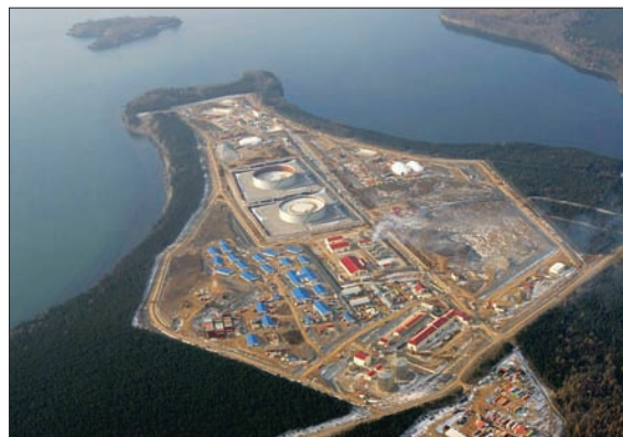
НЕФТЕПЕРЕГРУЗОЧНЫЙ ТЕРМИНАЛ В ПОС. ДЕ-КАСТРИ

Как раз здесь активно формируется новая прибрежная транспортно-промышленная зона: Де-Кастри – Ванино – Советская Гавань.