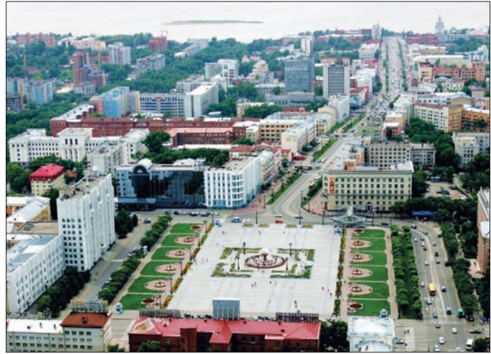
КРАЕВОЙ ЦЕНТР, ПЛОЩАДЬ ИМ. В.И. ЛЕНИНА

В крае ведется целенаправленная работа по модернизации и повышению надежности объектов энергетики, совершенствованию структуры топливного баланса, развитию собственной топливной базы.