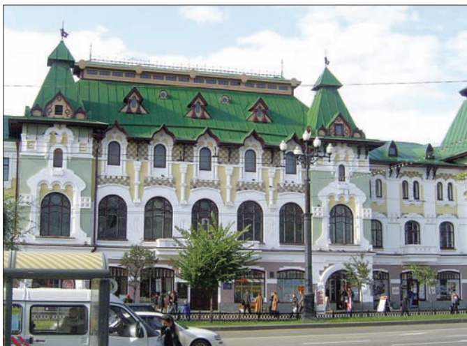
КРАЕВОЙ ЦЕНТР ДЕТСКОГО И ЮНОШЕСКОГО ТВОРЧЕСТВА

В научно-техническом секторе края занято около 6 тыс. работников, из которых более 400 докторов наук и свыше 2 тыс. кандидатов наук.