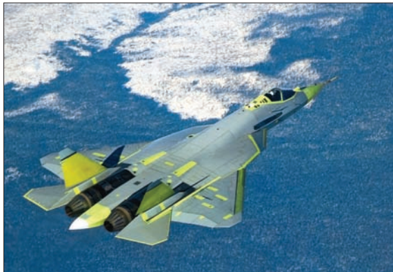
АВИАКОМПЛЕКС ПЯТОГО ПОКОЛЕНИЯ В ВОЗДУХЕ