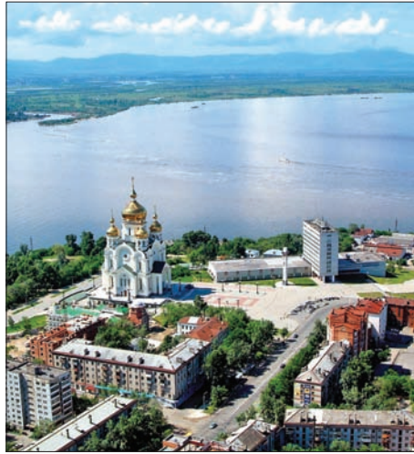
ВИД НА Р. АМУР И ПЛОЩАДЬ СЛАВЫ Г. ХАБАРОВСКА