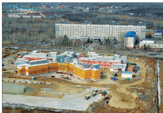
СТРОИТЕЛЬСТВО ФЕДЕРАЛЬНОГО ЦЕНТРА СЕРДЕЧНО-СОСУДИСТОЙ ХИРУРГИИ В Г. ХАБАРОВСКЕ