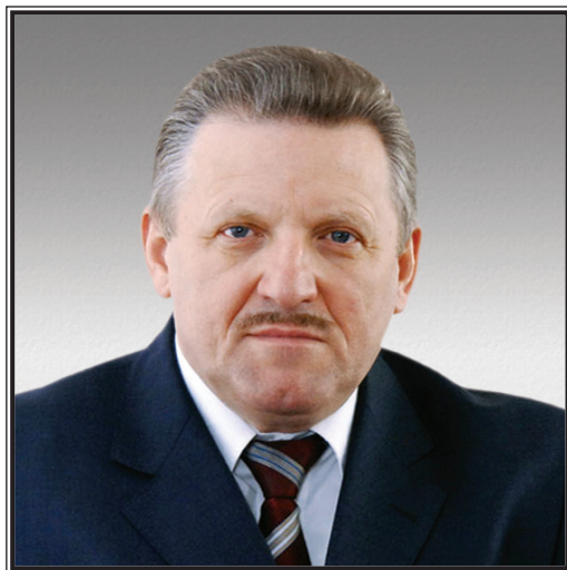
ГУБЕРНАТОР ХАБАРОВСКОГО КРАЯ Вячеслав Иванович Шпорт

Дальний Восток объективно имеет огромное значение в реализации национальных интересов России в Азиатско-Тихоокеанском регионе. При формировании государственной политики на востоке страны растет внимание Президента Российской Федерации, Правительства России к проблемам развития дальневосточных территорий, увеличиваются объемы государственной поддержки.