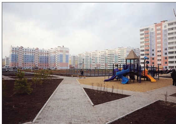
НОВЫЙ МИКРОРАЙОН ХАБАРОВСКА

судов для рыбодобывающего флота и др. На верфях края производятся быстроходные суда на воздушной каверне, воздушной подушке, освоен опыт строительства ответственных конструкций для морских буровых платформ.