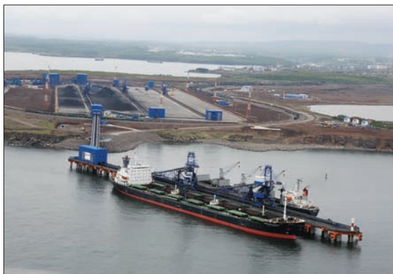
БАЛКЕРНЫЙ ТЕРМИНАЛ В ПОРТУ ВАНИНО