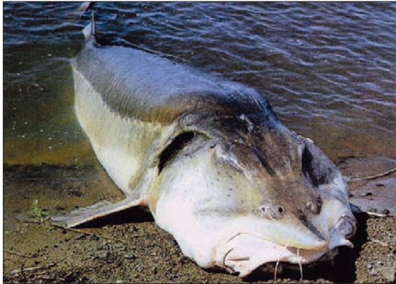
КАЛУГА – ЦАРЬ-РЫБА Р. АМУР