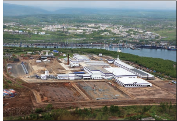
СОВРЕМЕННЫЙ ДЕРЕВООБРАБАТЫВАЮЩИЙ КОМПЛЕКС КОМПАНИИ «АРКАИМ»

Основной целью Стратегии выступает формирование такой территориальной социально-экономической системы, которая обеспечивала бы высокий жизненный уровень и качество жизни населения на основе эффективной и конкурентной экономики.