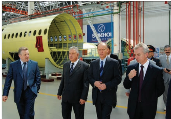
ЦЕХ ЗАО «ГРАЖДАНСКИЕ САМОЛЕТЫ СУХОГО»

молетов Sukhoi SuperJet-100. При выходе на проектную мощность планируется строительство 70 авиалайнеров в год.