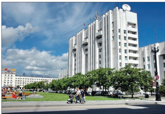
ЗДАНИЕ ПРАВИТЕЛЬСТВА ХАБАРОВСКОГО КРАЯ