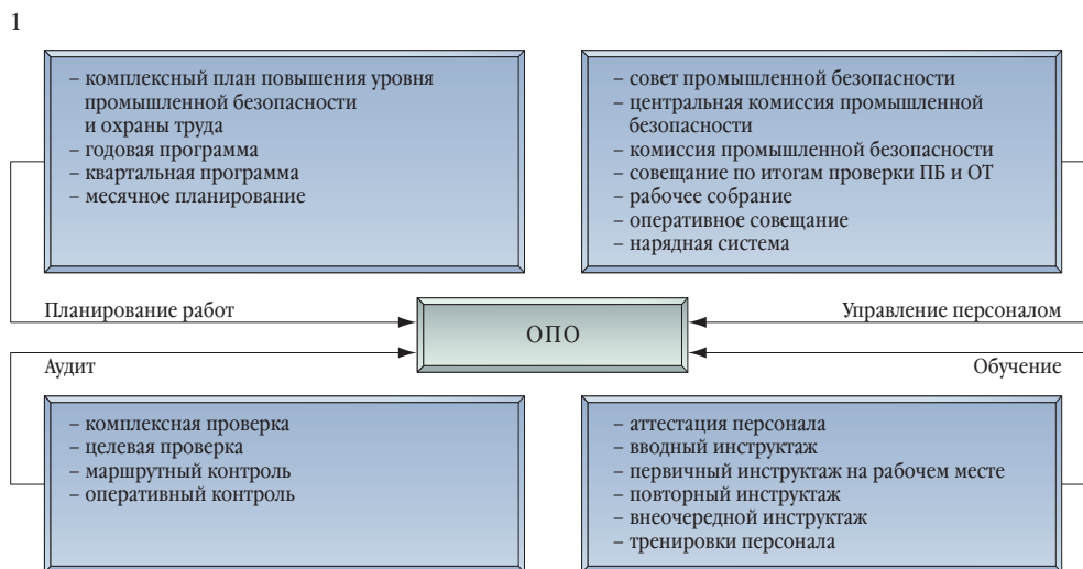
РЕГЛАМЕНТ ПРОФИЛАКТИЧЕСКИХ РАБОТ В РАМКАХ СУПБ