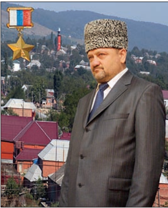
ПЕРВЫЙ ПРЕЗИДЕНТ ЧЕЧЕНСКОЙ РЕСПУБЛИКИ АХМАТ-ХАДЖИ КАДЫРОВ