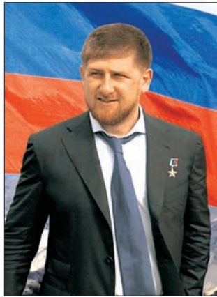
ПРЕЗИДЕНТ ЧЕЧЕНСКОЙ РЕСПУБЛИКИ РАМЗАН АХМАТОВИЧ КАДЫРОВ