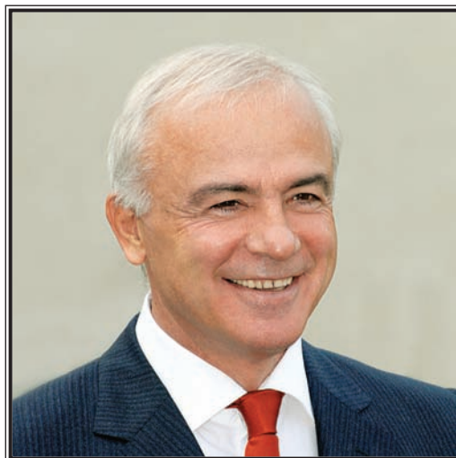
ПРЕЗИДЕНТ РЕСПУБЛИКИ АДЫГЕЯ Асланчерий Китович Тхакушинов

Республика Адыгея – регион с большими перспективами развития, имеющий огромные инвестиционные возможности. Располагая благоприятными для организации туризма природными и климатическими условиями, сырьевыми ресурсами, квалифицированной рабочей силой, республика обладает серьезным промышленным и аграрным потенциалом. При этом Адыгея, числясь в общем списке регионов России под номером 1, к сожалению, по социально-экономическим показателям долгое время значительно отставала от лидеров Южного федерального округа.