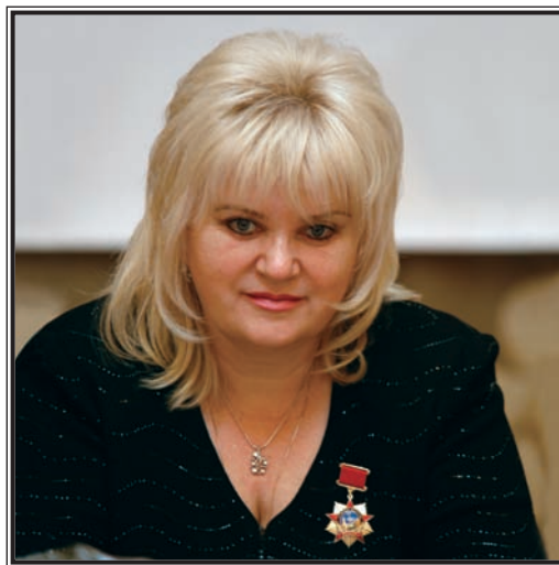
ЗАМЕСТИТЕЛЬ ПРЕДСЕДАТЕЛЯ ГОСУДАРСТВЕННОЙ ДУМЫ ФЕДЕРАЛЬНОГО СОБРАНИЯ РОССИЙСКОЙ ФЕДЕРАЦИИ Надежда Васильевна Герасимова

В общегосударственной системе охраны здоровья населения страны важное место отводится санаторно-курортному лечению.