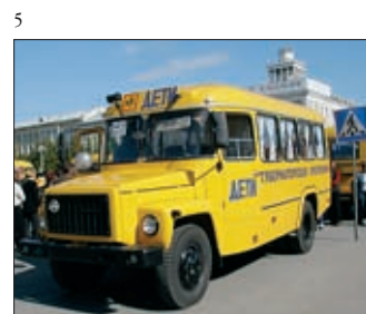
5 В КУРГАНСКОЙ ОБЛАСТИ ДЕЙСТВУЕТ ГУБЕРНА- ТОРСКАЯ ПРОГРАММА «ШКОЛЬНЫЙ АВТОБУС»