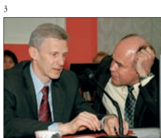
3 МИНИСТР ОБРАЗОВАНИЯ И НАУКИ РФ А.А. ФУРСЕНКО И РЕКТОР МОСКОВСКОГО ПЕДАГОГИЧЕСКОГО ГОСУДАРСТВЕННОГО УНИВЕРСИТЕТА В.Л. МАТРОСОВ