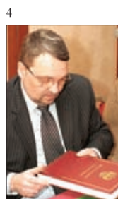
4 ЗАМ. РУКОВОДИТЕЛЯ ФССН В.В. ИОНКИН НА ПРЕЗЕНТАЦИИ «ФЕДЕРАЛЬНОГО СПРАВОЧНИКА»