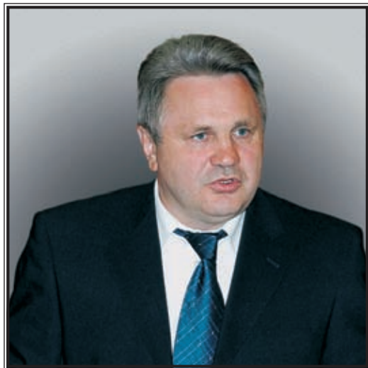
АУДИТОР СЧЕТНОЙ ПАЛАТЫ РФ Михаил Иванович Бесхмельницын

Жилищная проблема продолжает оставаться одной из самых острых в нашей стране, затрагивая интересы миллионов граждан Российской Федерации.