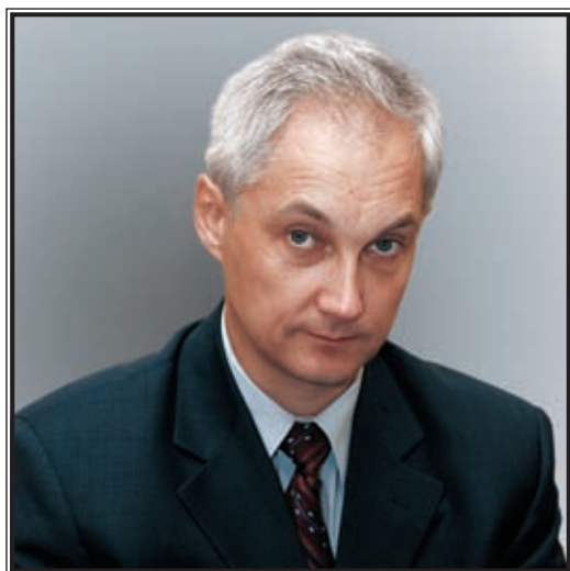
ЗАМЕСТИТЕЛЬ МИНИСТРА ЭКОНОМИЧЕСКОГО РАЗВИТИЯ И ТОРГОВЛИ РФ Андрей Рэмович Белоусов