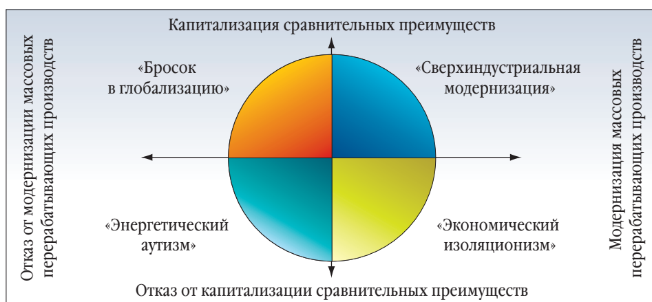
СЦЕНАРИЙ СВЕРХИНДУСТРИАЛЬНОЙ МОДЕРНИЗАЦИИ, 2005–2008 ГОДЫ

Технологический барьер может означать закрепление за Россией статуса энергетического придатка развитых стран, с полной утратой долгосрочных основ конкурентоспособности.