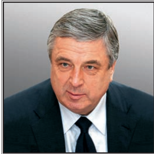
ГОСУДАРСТВЕННЫЙ СЕКРЕТАРЬ СОЮЗНОГО ГОСУДАРСТВА Павел Павлович Бородин