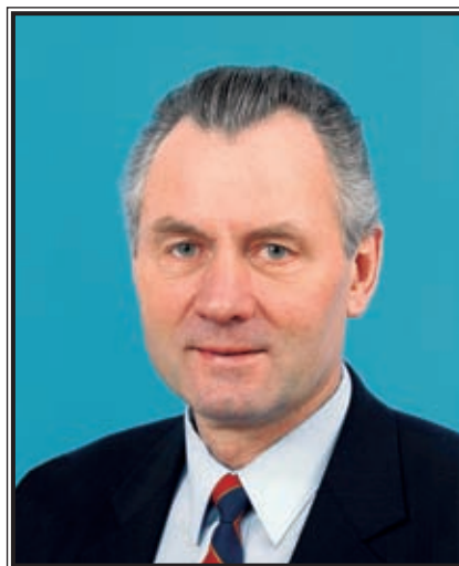
ГУБЕРНАТОР КИРОВСКОЙ ОБЛАСТИ Николай Иванович Шаклеин

Всемерно стимулируя подъем экономики как основы повышения уровня жизни населения, правительство области оказывает наиболее перспективным с точки зрения эффективности инвестиционным проектам государственную поддержку за счет областного бюджета в рамках осуществления разработанной на 2002–2006 годы региональной целевой программы «Повышение инвестиционной привлекательности Кировской области». Это могут быть государственные гарантии, бюджетный кредит, субсидии на покрытие части процентной ставки по банковскому кредиту, налоговая льгота, обеспечение залогом привлекаемых инвестиционных ресурсов. Региональным законодательством установлен порядок предоставления поддержки только на основе конкурсного отбора. Ежегодно его организует консультативный совет по инвестиционной политике при правительстве области. За три последних года он рассмотрел около полусотни заявок от акционерных обществ, обществ с ограниченной ответственностью, других субъектов инвестиционной деятельности, руководствуясь прежде всего комплексной оценкой экономической и социальной эффективности проектов. Во внимание принимаются также результаты проверки финансового состояния заявителей, соответствие представленной ими конкурсной документации предъявляемым требованиям.