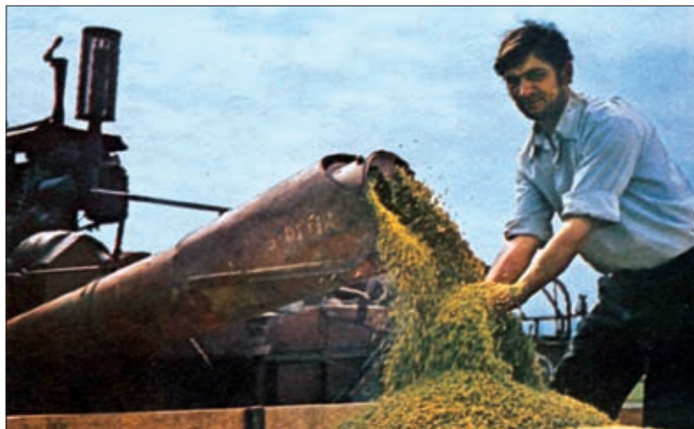
ХЛЕБ – ВСЕМУ ГОЛОВА

ственных фондов. Их сверхнормативная изношенность в промышленности, на транспорте у нас достигает 60%, а в сельском хозяйстве и того больше. На улучшение этой ситуации и направлено законодательное стимулирование роста вложений в основной капитал.