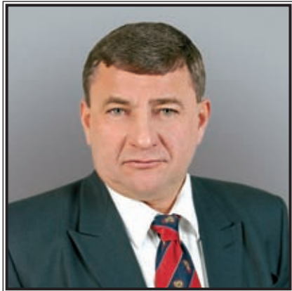
ПРЕДСЕДАТЕЛЬ ПРАВИТЕЛЬСТВА РЕСПУБЛИКИ ХАКАСИЯ Алексей Иванович Лебедев