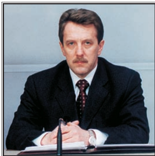
МИНИСТР СЕЛЬСКОГО ХОЗЯЙСТВА РОССИЙСКОЙ ФЕДЕРАЦИИ Алексей Васильевич Гордеев

5 сентября 2005 года на совещании с членами Правительства, руководством Федерального Собрания и членами президиума Государственного совета Президент Российской Федерации В.В. Путин отнес вопросы улучшения жизни на селе, развития агропромышленного производства к числу приоритетов государственной социально-экономической политики.