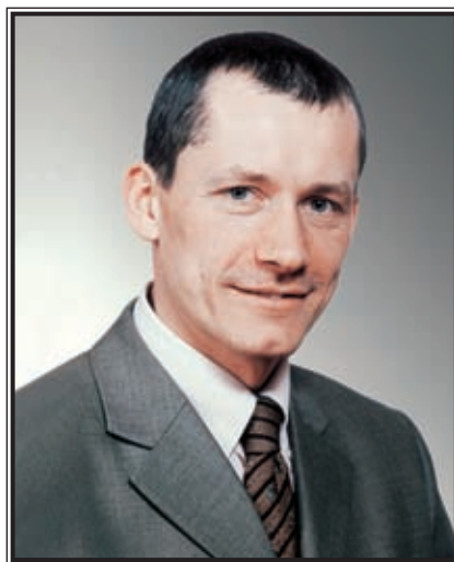
ЗАМЕСТИТЕЛЬ МИНИСТРА ЭКОНОМИЧЕСКОГО РАЗВИТИЯ И ТОРГОВЛИ РОССИЙСКОЙ ФЕДЕРАЦИИ Андрей Владимирович Шаронов

Седьмой год в России продолжается экономический рост, хотя в последнее время темпы его несколько замедлились.