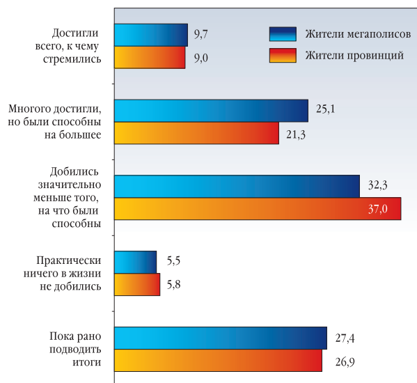
ОЦЕНКА СТЕПЕНИ РЕАЛИЗОВАННОСТИ СВОИХ ЖИЗНЕННЫХ ПЛАНОВ ЖИТЕЛЯМИ МЕГАПОЛИСОВ И ПРОВИНЦИЙ (В ПРОЦЕНТАХ)

тельных экономических стратегий. Так, если в целом о том, что денег не хватает на текущие расходы, не говоря уже о сбережениях, сообщило 20,6% жителей мегаполисов, 29,0% жителей крупных областных центров и 36,3% жителей малых городов, то среди тех, кто вынужден «вернуться», комбинируя разнообразные способы улучшения собственного материального положения, насчитывается уже 34,6% первых, 38,7% вторых и 55,0% третьих.