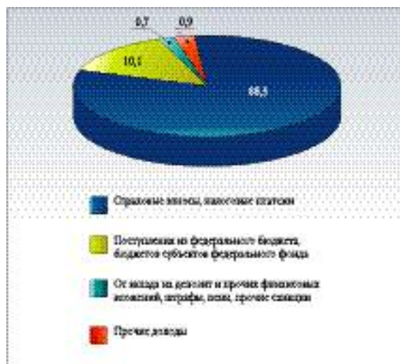
СТРУКТУРА СРЕДСТВ, ПОСТУПИВШИХ В ГОСУДАРСТВЕННЫЕ СОЦИАЛЬНЫЕ ВНЕБЮДЖЕТНЫЕ ФОНДЫ В 2002 ГОДУ (В ПРОЦЕНТАХ К ИТОГУ)