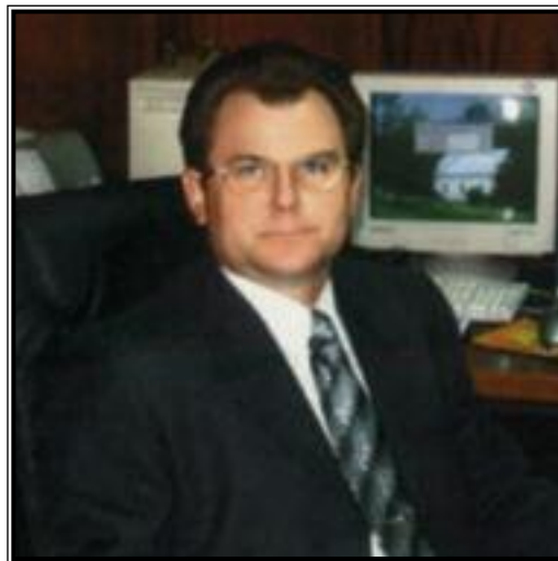
ПЕРВЫЙ ЗАМЕСТИТЕЛЬ ПРЕДСЕДАТЕЛЯ ГОСУДАРСТВЕННОГО КОМИТЕТА РОССИЙСКОЙ ФЕДЕРАЦИИ ПО СТАТИСТИКЕ Константин Эмильевич Лайкам

Внебюджетные фонды представляют собой одну из форм организации финансовых ресурсов, находящихся в распоряжении государства и имеющих целевое назначение.