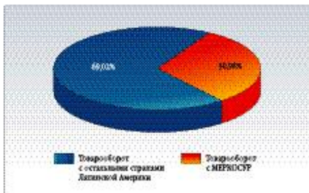
ДОЛЯ МЕРКОСУР В ТОВАРООБОРОТЕ РОССИИ СО СТРАНАМИ ЛАТИНСКОЙ АМЕРИКИ В I ПОЛУГОДИИ 2003 ГОДА (ПО ДАННЫМ ГТК РОССИИ)

выступлений на рынках в третьих странах.