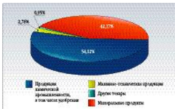
СТРУКТУРА РОССИЙСКОГО ЭКСПОРТА В МЕРКОСУР В I ПОЛУГОДИИ 2003 ГОДА (ПО ДАННЫМ ГТК РОССИИ)

ских производителей к зарубежным рынкам продажи российской автотехники практически прекратились. Их возобновление в 1999 году связано с новой политикой «АвтоВАЗа» в Латинской Америке и началом работы через компанию со 100%-ным российским участием «Россия аутомотриз», выбравшую в качестве базы для поставок автомобилей в регион свободную экономическую зону Уругвая. Кроме того, с 1998 года начались поставки российских машин и оборудования (железнодорожных рельсов, грузовых автомобилей «Урал») в счет погашения задолженности бывшего СССР перед Уругваем.