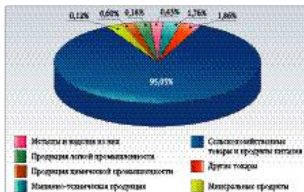
СТРУКТУРА РОССИЙСКОГО ИМПОРТА В МЕРКОСУР В I ПОЛУГОДИИ 2003 ГОДА (ПО ДАННЫМ ГТК РОССИИ)

остается незначительным: 2000 год – 0,2 млн. долл.; 2001 год – 3,1 млн. долл., 2002 год – 5,1 млн. долл. Российский экспорт представлен удобрениями, электроприборами, оптикой, химтоварами, алкогольными напитками.