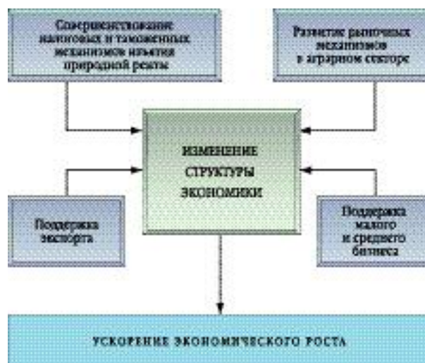
ИЗМЕНЕНИЕ СТРУКТУРЫ ЭКОНОМИКИ

время не оказывая значительного влияния на поступления от налоговых сборов;