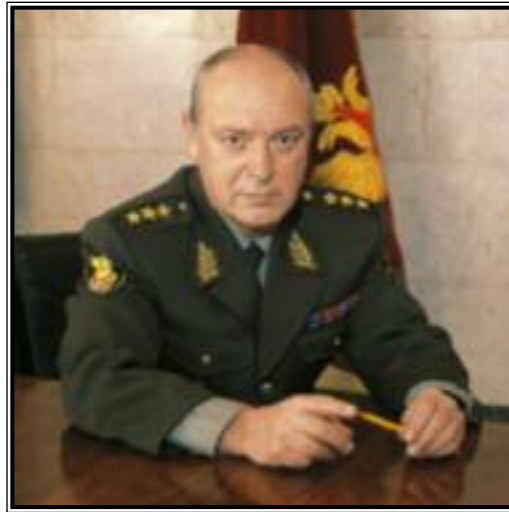
ДИРЕКТОР ГОСУДАРСТВЕННОЙ ФЕЛЬДЪЕГЕРСКОЙ СЛУЖБЫ РОССИЙСКОЙ ФЕДЕРАЦИИ Андрей Григорьевич Черненко

Государственная фельдъегерская служба Российской Федерации (ГФС России) является федеральным органом исполнительной власти, осуществляющим специальные функции в сфере обеспечения федеральной фельдъегерской связи в Российской Федерации.