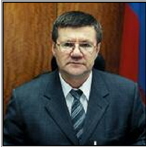
МИНИСТР ЮСТИЦИИ РОССИЙСКОЙ ФЕДЕРАЦИИ Юрий Яковлевич Чайка

Министерство юстиции Российской Федерации вступило в 200-й год со дня своего образования. Цифра, что и говорить, значимая. В связи с этим, думаю, уместно вспомнить основные исторические вехи его возникновения и развития.