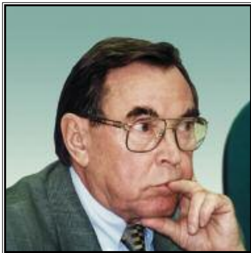
ПРЕДСЕДАТЕЛЬ ВЫСШЕГО АРБИТРАЖНОГО СУДА РОССИЙСКОЙ ФЕДЕРАЦИИ Вениамин Федорович Яковлев

Сложившаяся в современной России судебная система состоит из трех элементов. Первый – это Конституционный Суд Российской Федерации и конституционные (уставные) суды, осуществляющие конституционное правосудие. Второй элемент – это суды общей юрисдикции, к которым относятся также военные и мировые суды. Эта система, во главе которой находится Верховный Суд Российской Федерации, осуществляет гражданское, административное и уголовное правосудие по делам, не отнесенным к юрисдикции других судов. Третья составная часть – это арбитражные суды Российской Федерации во главе с Высшим Арбитражным Судом России. Эти суды осуществляют гражданское и административное судопроизводство по экономическим спорам, связанным с предпринимательской деятельностью, а также вообще с деятельностью юридических лиц.