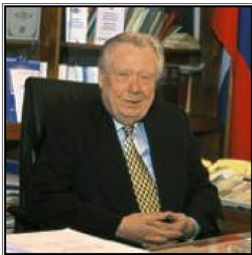
ПРЕДСЕДАТЕЛЬ КОНСТИТУЦИОННОГО СУДА РОССИЙСКОЙ ФЕДЕРАЦИИ Марат Викторович Баглай

Конституционный Суд Российской Федерации — судебный орган конституционного контроля. Он входит в систему судебной власти, которая вместе с законодательной и исполнительной властью осуществляет государственную власть в стране. При этом Конституционный Суд является самым молодым органом власти. В 2001 г. он отметил лишь первое десятилетие своего существования.