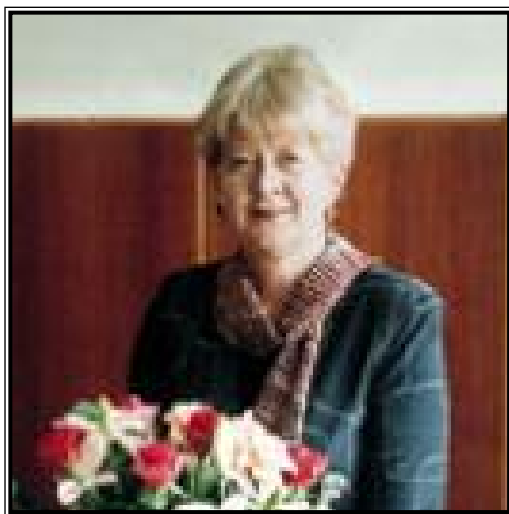
ПЕРВЫЙ ЗАМЕСТИТЕЛЬ МИНИСТРА КУЛЬТУРЫ РОССИЙСКОЙ ФЕДЕРАЦИИ Наталья Леонидовна Дементьева

Сегодня в Российской Федерации около 2000 государственных и муниципальных музеев (вместе с филиалами), более 100 государственных ведомственных музеев. Государственная часть Музейного фонда Российской Федерации насчитывает 7,65 млн. предметов, в музеях России работает около 50 тысяч сотрудников, ежегодно музеи посещают более 70 млн. человек.