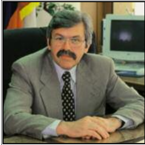
ПРЕДСЕДАТЕЛЬ ГОСКОМСТАТА РОССИИ Владимир Леонидович Соколин

Завершился 2001 год – первый год нового века, нового тысячелетия. Для России этот год был временем укрепления нашей государственности, выстраивания президентской «вертикали», упрочения нашей экономики. Кстати, именно наши данные, статистические показатели, разрабатываемые Госкомстатом России, убедительно характеризуют рост валового внутреннего продукта и промышленного производства, сокращение рисков для отечественного социально-экономического развития. По итогам года можно сказать главное: 2001 год будет вписан в историю российской экономики как год удачный, год успешный. Это подтверждает вся текущая статистика.