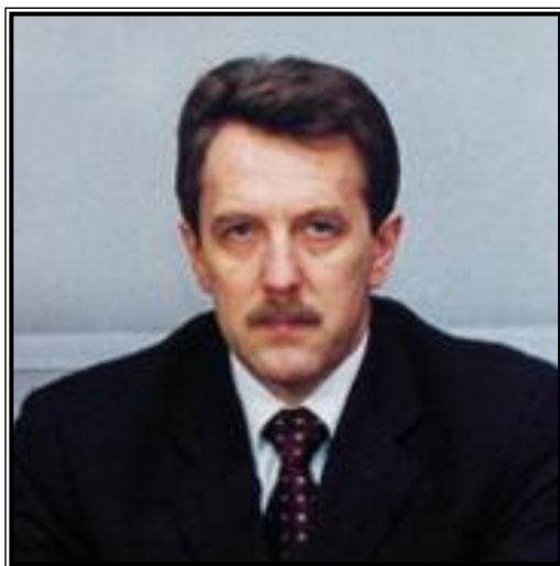
ЗАМЕСТИТЕЛЬ ПРЕДСЕДАТЕЛЯ ПРАВИТЕЛЬСТВА РОССИЙСКОЙ ФЕДЕРАЦИИ Алексей Васильевич Гордеев

В последние годы в наш лексикон вошло ранее неизвестное и практически неприменяемое понятие «продовольственная безопасность государства». В широком понимании это определение характеризует трудности той или иной страны в продовольственном обеспечении населения в силу возникших социально-экономических проблем. При этом речь не идет о проблемах чрезвычайного продовольственного положения, созданного войнами, эпидемиями и т.д. То есть, продовольственная безопасность государства напрямую связана с тем, насколько объемы производства сельхозпродукции и непосредственно продуктов питания удовлетворяют потребность населения.