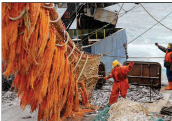
ОБСУЖДАЕТСЯ ВОЗМОЖНОСТЬ ВВЕДЕНИЯ ЕДИНОГО ПРОМЫСЛОВОГО ПРОСТРАНСТВА ДЛЯ СНИЖЕНИЯ АДМИНИСТРАТИВНЫХ БАРЬЕРОВ

ления квот. Вместе с тем для повышения эффективности промысла предполагается увеличить порог освоения долей квот с 50 до 70%, при этом не менее 70% объема полученной квоты пользователи должны будут осваивать на собственных рыбопромысловых судах или на судах, приобретенных по лизингу. Введение этих правил поможет избавиться от «квотных рантье». По разным оценкам, даже для самого массового объекта промысла – минтая – сейчас от 10 до 15% от общего объема квот принадлежит компаниям, которые не имеют своего рыбопромыслового флота. Тем не менее «прозрачные» холдинги смогут продолжить работу в обычном режиме: предусмотрена возможность использования судов одной группой лиц.