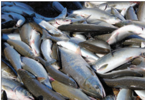
КОМПАНИИ, КОТОРЫЕ ВЫБЕРУТ ПРИБРЕЖНОЕ РЫБОЛОВСТВО, БУДУТ ОБЯЗАНЫ ДОСТАВЛЯТЬ УЛОВЫ НА БЕРЕГОВЫЕ РЫБОПЕРЕРАБАТЫВАЮЩИЕ ЗАВОДЫ