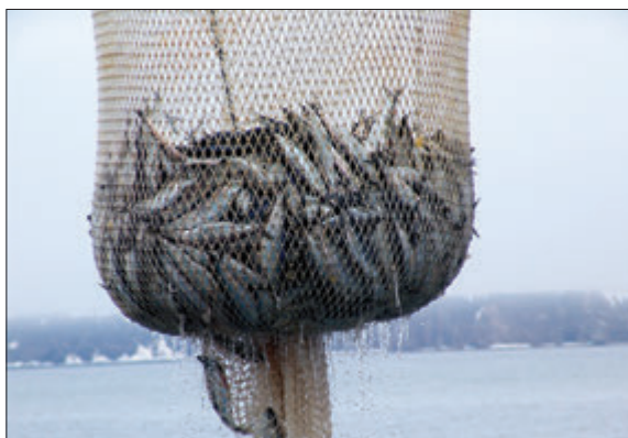
НА ДОЛЮ РОССИИ ПРИХОДИТСЯ ПРИМЕРНО 4,5% ГЛОБАЛЬНОГО ВЫЛОВА, ЭТО 4,2 МЛН Т РЫБЫ И МОРЕПРОДУКТОВ В ГОД