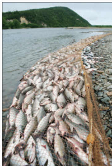
В ЛЕТНЕ-ОСЕННИЙ ПЕРИОД НА ДАЛЬНЕМ ВОСТОКЕ ИДЕТ ЛОСОСЕВАЯ, ИЛИ «КРАСНАЯ», ПУТИНА