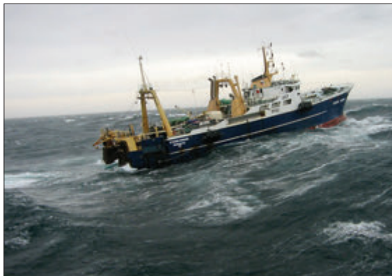
РАЗРАБОТАННЫЕ МЕРЫ РАЗВИТИЯ ПОЗВОЛЯТ УВЕЛИЧИТЬ ВАЛОВОЙ ОБОРОТ РЫБНОЙ ОТРАСЛИ ПРИМЕРНО НА 50%

и в смежных отраслях экономики. Созданы территории опережающего социально-экономического развития в Приморье и Хабаровском крае, морской порт Владивосток наделен статусом свободного порта, приняты или находятся в проработке законодательные инициативы, стимулирующие инвестиции. Проекты ведутся и в Центральной России. Так, планируется выстроить логистическую цепочку Владивосток – Новосибирск – Селятино и в обратном направлении. Часть средств на проект заложена в государственной программе Минсельхоза России, и средства начнут использоваться уже с 2016 года. Таким образом, повысится эффективность поставок рыбопродукции с Дальнего Востока, а также – в качестве обратной загрузки – появится возможность организовать доставку отечественной плодоовощной и мясомолочной продукции из центра в Дальневосточный федеральный округ. При этом будут использованы существующие мощности рыбных терминалов морских портов, находящиеся в управлении подведомственного Росрыболовству ФГУП «Нацрыбресурс», в рамках программы по повышению эффективности эксплуатации причальных комплексов, согласованной с заинтересованными ведомствами.