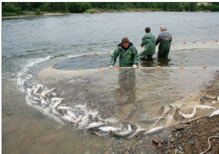
ВЫЛОВ ТИХООКЕАНСКИХ ЛОСОСЕЙ НА ДАЛЬНЕМ ВОСТОКЕ РОССИИ В 2015 ГОДУ ПРЕВЫСИЛ 373 ТЫС. Т

видов продуктов и выходе на новые рынки сбыта. Но при этом общий объем инвестиций в основной капитал за 2014 год составил только 12,7 млрд рублей – 7,5% от оборота. Для сравнения: по сельскому и лесному хозяйству в целом соотношение инвестиций к обороту составляет более 26%. С 2009 года построено всего 16 рыболовных судов, из которых 10 – малотоннажные.