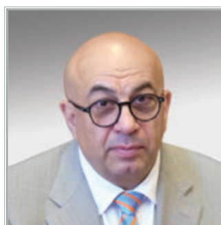
ИСПОЛНЯЮЩИЙ ОБЯЗАННОСТИ ПРЕДСЕДАТЕЛЯ ФГБНИИ «СОВЕТ ПО ИЗУЧЕНИЮ ПРОИЗВОДИТЕЛЬНЫХ СИЛ» МИНЭКОНОМРАЗВИТИЯ РОССИИ И РАН Александр Григорьевич Шнайдер