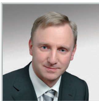
МИНИСТР ОБРАЗОВАНИЯ И НАУКИ РОССИЙСКОЙ ФЕДЕРАЦИИ Дмитрий Викторович Ливанов