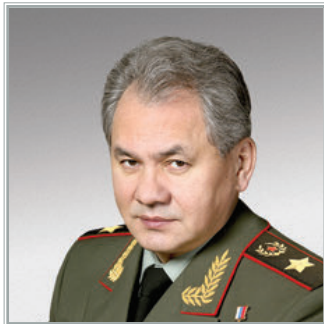
МИНИСТР ОБОРОНЫ РОССИЙСКОЙ ФЕДЕРАЦИИ Сергей Кужугетович Шойгу