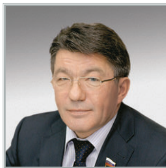
ПРЕДСЕДАТЕЛЬ КОМИТЕТА СОВЕТА ФЕДЕРАЦИИ ПО ОБОРОНЕ И БЕЗОПАСНОСТИ Виктор Алексеевич Озеров