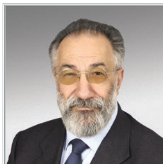
СПЕЦИАЛЬНЫЙ ПРЕДСТАВИТЕЛЬ ПРЕЗИДЕНТА РОССИЙСКОЙ ФЕДЕРАЦИИ ПО МЕЖДУНАРОДНОМУ СОТРУДНИЧЕСТВУ В АРКТИКЕ И АНТАРКТИКЕ, ПЕРВЫЙ ВИЦЕ-ПРЕЗИДЕНТ РУССКОГО ГЕОГРАФИЧЕСКОГО ОБЩЕСТВА Артур Николаевич Чилингаров