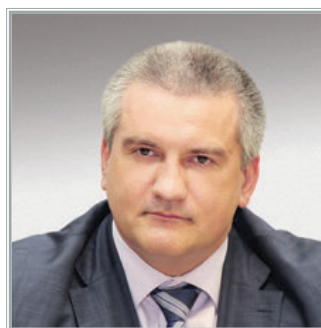
ГЛАВА РЕСПУБЛИКИ КРЫМ, ПРЕДСЕДАТЕЛЬ СОВЕТА МИНИСТРОВ РЕСПУБЛИКИ КРЫМ Сергей Валерьевич Аксёнов