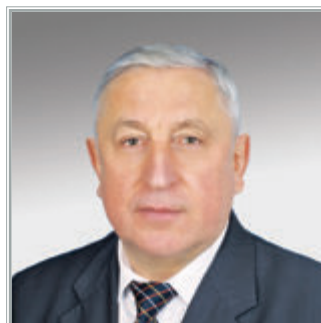
ПРЕДСЕДАТЕЛЬ КОМИТЕТА ГОСУДАРСТВЕННОЙ ДУМЫ ПО РЕГИОНАЛЬНОЙ ПОЛИТИКЕ И ПРОБЛЕМАМ СЕВЕРА И ДАЛЬНЕГО ВОСТОКА Николай Михайлович Харитонов