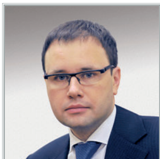
ЗАМЕСТИТЕЛЬ МИНИСТРА ТРУДА И СОЦИАЛЬНОЙ ЗАЩИТЫ РОССИЙСКОЙ ФЕДЕРАЦИИ Григорий Григорьевич Лекарев