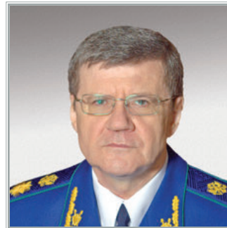
ГЕНЕРАЛЬНЫЙ ПРОКУРОР РОССИЙСКОЙ ФЕДЕРАЦИИ Юрий Яковлевич Чайка