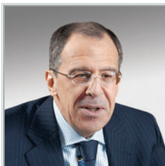
МИНИСТР ИНОСТРАННЫХ ДЕЛ РОССИЙСКОЙ ФЕДЕРАЦИИ Сергей Викторович Лавров