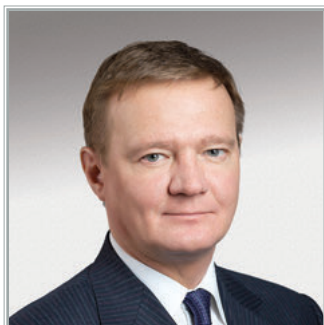
РУКОВОДИТЕЛЬ ФЕДЕРАЛЬНОГО ДОРОЖНОГО АГЕНТСТВА Роман Владимирович Старовойт