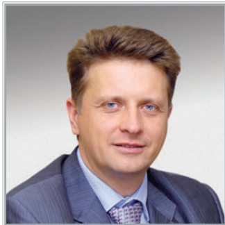
МИНИСТР ТРАНСПОРТА РОССИЙСКОЙ ФЕДЕРАЦИИ Максим Юрьевич Соколов