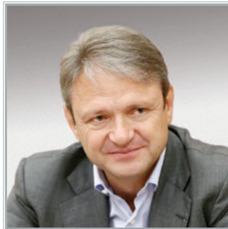
МИНИСТР СЕЛЬСКОГО ХОЗЯЙСТВА РОССИЙСКОЙ ФЕДЕРАЦИИ Александр Николаевич Ткачѐв