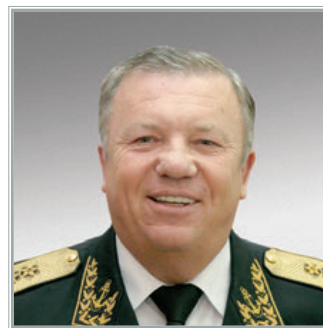
ПРЕДСЕДАТЕЛЬ КОМИТЕТА ГОСУДАРСТВЕННОЙ ДУМЫ ПО ОБОРОНЕ Владимир Петрович Комоедов