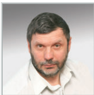
ЗАВЕДУЮЩИЙ ОТДЕЛОМ МОДЕЛИРОВАНИЯ НЕЛИНЕЙНЫХ ПРОЦЕССОВ ИИМ ИМЕНИ М.В. КЕЛДЫША РАН Георгий Геннадьевич Малинецкий