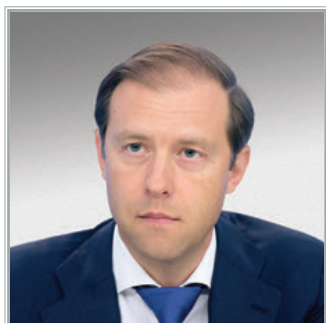
МИНИСТР ПРОМЫШЛЕННОСТИ И ТОРГОВЛИ РОССИЙСКОЙ ФЕДЕРАЦИИ Денис Валентинович Мантуров