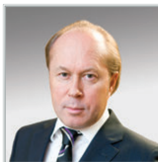
ПЕРВЫЙ ЗАМЕСТИТЕЛЬ ПРЕДСЕДАТЕЛЯ КОМИТЕТА ГОСУДАРСТВЕННОЙ ДУМЫ ПО НАУКЕ И НАУКОЕМКИМ ТЕХНОЛОГИЯМ Владимир Михайлович Кононов