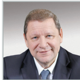
ЧЛЕН КОЛЛЕГИИ ЕВРАЗИЙСКОЙ ЭКОНОМИЧЕСКОЙ КОМИССИИ (МИНИСТР) ПО ПРОМЫШЛЕННОСТИ И АГРОПРОМЫШЛЕННОМУ КОМПЛЕКСУ Сергей Сергеевич Сидорский