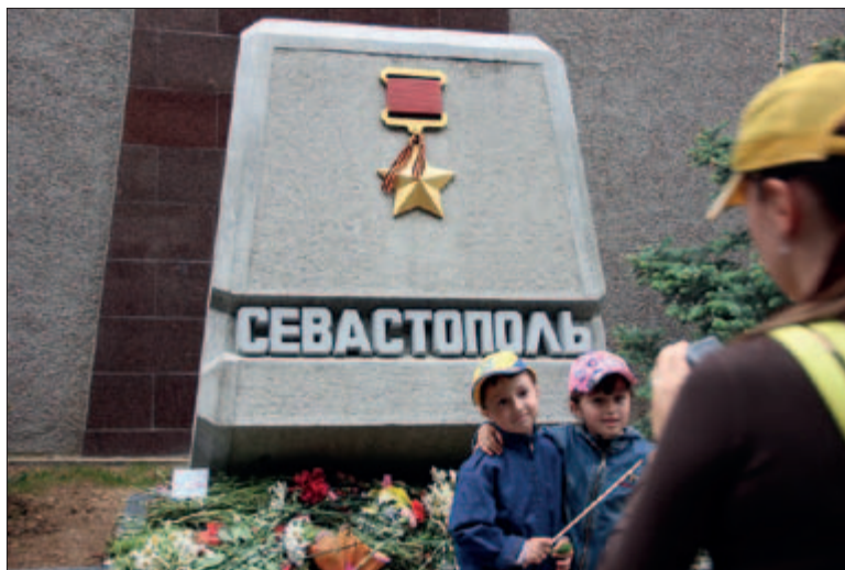
АЛЛЕЯ ГОРОДОВ-ГЕРОЕВ. СЕВАСТОПОЛЬ

Совершённый в 2014 году государственный переворот в Киеве вселил еще большую уверенность в успехе этих стратегических планов, поскольку новоявленное руководство Украины, полностью находившееся под влиянием американской администрации, уже к середине мая должно было заявить о денонсации договора о базировании Черноморского флота Российской Федерации. Главными целями всей этой стратегии, по мнению авторитетных экспертов, являлись Крым и Севастополь, контролю над которыми мешало присутствие там нашего Черноморского флота. Вывод его из Крыма позволял взять и полуостров и Севастополь под американский контроль.