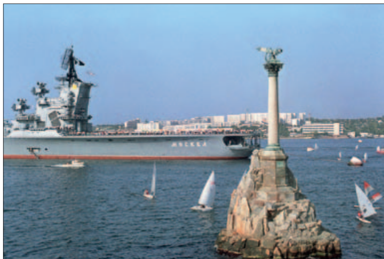
РАКЕТНЫЙ КРЕЙСЕР «МОСКВА», ФЛАГМАН ЧЕРНОМОРСКОГО ФЛОТА, У ПАМЯТНИКА ЗАТОПЛЕННЫМ КОРАБЛЯМ. СЕВАСТОПОЛЬ

Что касается Украины, то еще в 2008 году ее тогдашний президент В. Ющенко подписал хартию о стратегическом партнерстве с США. В ней США поддерживали планы Украины относительно укрепления безопасности и демократии, повышения благополучия путем усиленного экономического развития, энергосбережения, обеспечения качественными продуктами питания и эффективности государственного управления. Из всех украинских регионов Крым единственный был выделен отдельно, что свидетельствует о приоритетном значении полуострова для американской политики в отношении с Киевом в период, предшествовавший смене власти на Украине. Комментируя подписанную хартию, сами украинские политики подчеркивали, что она была направлена на вытеснение России из Крыма и размещение на его территории различных американских объектов, в том числе и элементов ПРО.