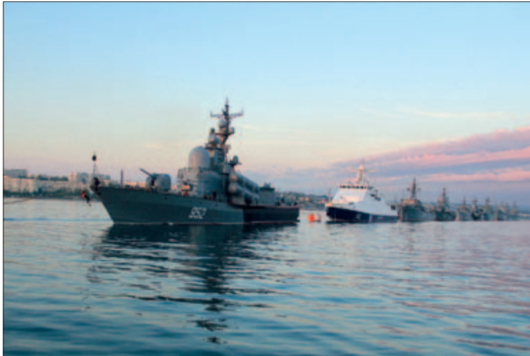
КОРАБЛИ ЧЕРНОМОРСКОГО ФЛОТА НА РЕЙДЕ В СЕВАСТОПОЛЬСКОЙ БУХТЕ

молетов-радаров AWACS, которые находятся в Румынии, Болгарии и Турции. Мы постоянно наблюдаем за ситуацией в Чёрном море и адаптируемся, увеличивая наши военные возможности».