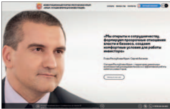
ПРИВЕТСТВЕННОЕ СЛОВО ГЛАВЫ РЕСПУБЛИКИ КРЫМ СЕРГЕЯ АКСИОНОВА, РАЗМЕЩЕННОЕ НА ИНВЕСТИЦИОННОМ ПОРТАЛЕ РЕСПУБЛИКИ КРЫМ