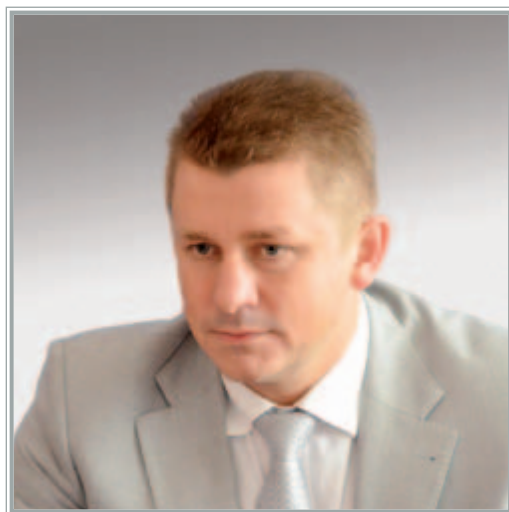
МИНИСТР ЭКОНОМИЧЕСКОГО РАЗВИТИЯ РЕСПУБЛИКИ КРЫМ Валентин Валентинович Демидов

Экономика Крыма активно набирает обороты, несмотря на серьезные объективные трудности: это и низкая транспортная доступность региона, и недостаточная обеспеченность водными, энергетическими и сырьевыми ресурсами, и высокая зависимость крымских производителей от поставок сырья и комплектующих. Не надо забывать и о том, что начало года мы встретили в режиме чрезвычайной ситуации в связи с дефицитом электроэнергии. Полуостров был полностью обесточен из-за подрыва опор. Тогда вышли из строя все 4 линии электропередачи, идущие с Украины.