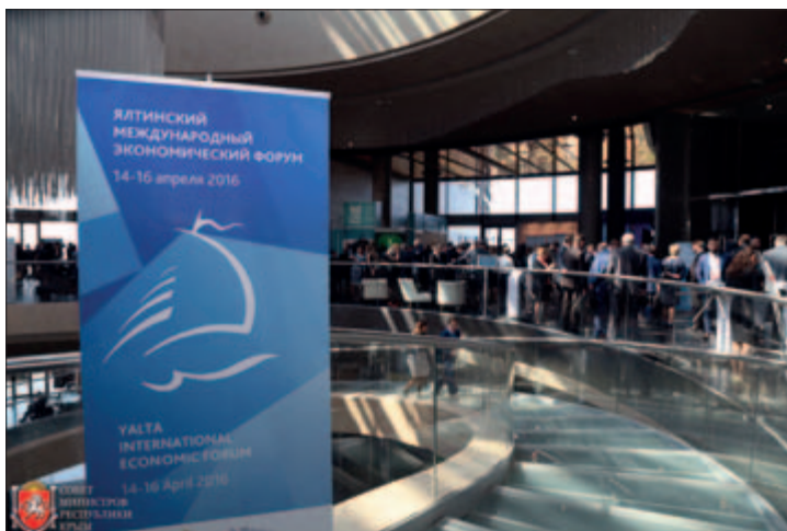
ЯЛТИНСКИЙ МЕЖДУНАРОДНЫЙ ЭКОНОМИЧЕСКИЙ ФОРУМ

тие и инновационная экономика» на 2015–2017 годы. Мероприятия указанной подпрограммы направлены на повышение инвестиционной активности, устранение административных барьеров, разработку и внедрение мер государственной поддержки субъектов инвестиционной деятельности, продвижение позитивного имиджа Республики Крым и др.