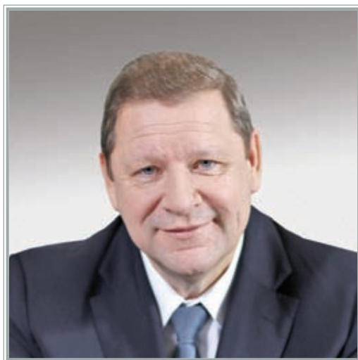
ЧЛЕН КОЛЛЕГИИ ЕВРАЗИЙСКОЙ ЭКОНОМИЧЕСКОЙ КОМИССИИ (МИНИСТР) ПО ПРОМЫШЛЕННОСТИ И АГРОПРОМЫШЛЕННОМУ КОМПЛЕКСУ Сергей Сергеевич Сидорский

Вопросы обеспечения продовольственной безопасности являются одними из ключевых в экономической, политической и социальной жизни стран Евразийского экономического союза (далее – ЕАЭС, Союз).