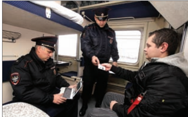
СОТРУДНИКИ СИМФЕРОПОЛЬСКОГО ЛО МВД РОССИИ НА ТРАНСПОРТЕ ПРОВЕРЯЮТ ДОКУМЕНТЫ У ПассажиРА

ный завод «Ремпутьмаш» крупной партии контрафактных автосцепок на общую сумму 90 млн рублей по поддельным документам.