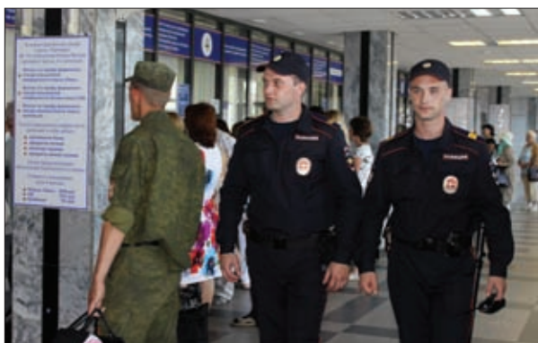
НАРЯД ТРАНСПОРТНОЙ ПОЛИЦИИ НА ВОКЗАЛЕ

кими преступлениями, заметно превысил общероссийский. Всего транспортной полицией было обеспечено возмещение свыше 1,4 млрд рублей причиненного ущерба.