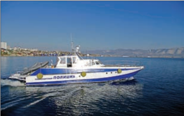
ПОЛИЦЕЙСКИЙ КАТЕР ВЫХОДИТ НА ПАТРУЛИРОВАНИЕ

это первое испытание крымской транспортной полицией было успешно пройдено.