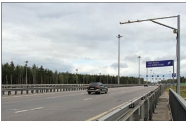
ОПОРА КРЕПЛЕНИЯ ОБОРУДОВАНИЯ СИСТЕМ ВИДЕОНАБЛЮДЕНИЯ, ОПОВЕЩЕНИЯ, ОХРАННОГО ОСВЕЩЕНИЯ