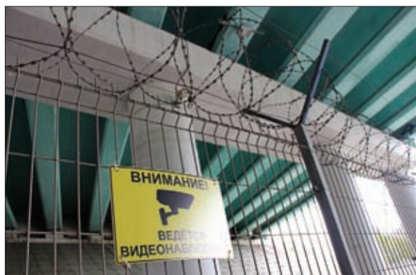
ОГРАЖДЕНИЕ ЗОНЫ ТРАНСПОРТНОЙ БЕЗОПАСНОСТИ

например, отслеживать перемещения объекта. При срабатывании датчика движения загорается прожектор, что в случае возможного незаконного вмешательства моментально обращает внимание оператора за пультом на участок зоны транспортной безопасности.