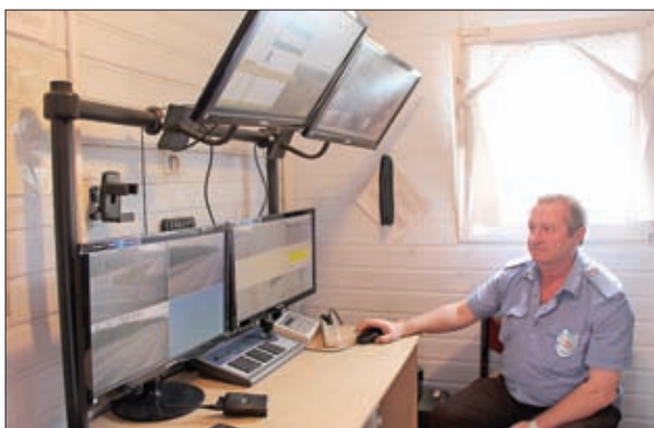
ОПЕРАТОР ИТСОБ НА РАБОЧЕМ МЕСТЕ