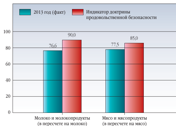
УДЕЛЬНЫЙ ВЕС ОТЕЧЕСТВЕННОЙ ПРОДУКЦИИ ЖИВОТНОВОДСТВА В ОБЩЕМ ОБЪЕМЕ РЕСУРСОВ (С УЧЕТОМ СТРУКТУРЫ ПЕРЕХОДЯЩИХ ЗАПАСОВ), %

АПК, и прежде всего его базовой отрасли – сельского хозяйства. Его состояние и эффективность оказывают решающее влияние на продовольственное обеспечение и жизненный уровень населения.