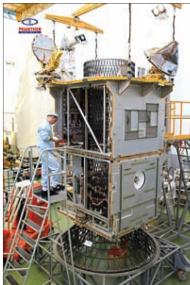
КОСМИЧЕСКИЙ АППАРАТ «ЛУЧ-5Б». СТЫКОВКА ПОЛЕЗНОЙ НАГРУЗКИ И ПЛАТФОРМЫ