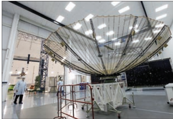
ТРАНСФОРМИРУЕМЫЙ РЕФЛЕКТОР (Ø 4 М) ПЕРЕНАЦЕЛИВАЕМОЙ АНТЕННЫ КА «ЛУЧ-5А/Б/В»

Новые технологии изготовления труб, штанг и несущей струнной подложки повысили качество, жесткость и надежность каркасов БС; массовая доля углепластиковых элементов в конструкции каркасов БС возросла до 95%.