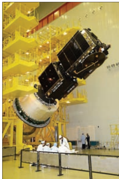
КОСМИЧЕСКИЕ АППАРАТЫ «ЭКСПРЕСС-АТ1» И «ЭКСПРЕСС-АТ2». ТАНДЕМНАЯ СХЕМА ВЫВЕДЕНИЯ

конструкционно-технологических решений позволил существенно сократить сроки создания и обеспечить необходимую надежность.