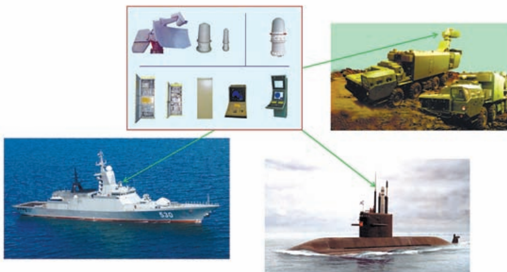
РАДИОЭЛЕКТРОННЫЕ КОМПЛЕКСЫ УПРАВЛЕНИЯ КРЫЛАТЫХ РАКЕТ