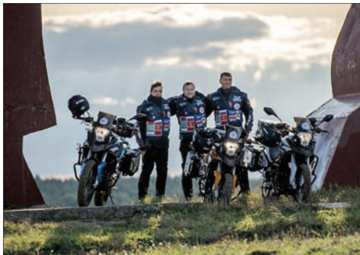
УЧАСТНИКИ АВТОМОТОПРОБЕГА ПО ТЕРРИТОРИИ ГОСУДАРСТВ – ЧЛЕНОВ ОДКБ «ВМЕСТЕ – МЫ СИЛА!», СЕНТЯБРЬ 2013 ГОДА

по интересам, различные спортивные соревнования. В качестве примеров такой работы можно привести состоявшийся под флагом ОДКБ мотопробег по территории государств-членов на технике отечественного производства (рис. 5); регулярные соревнования команд силовых ведомств государств-членов по комплексному единоборству на Кубок Совета коллективной безопасности и т.д. Прорабатывается идея создания университетской лиги – неформального объединения студентов ведущих университетов государств – членов организации. Продолжается процесс создания на территории Республики Армения академии ОДКБ, призванной стать эффективным образовательным учреждением для подготовки специалистов в области обеспечения безопасности из государств – членов организации и других иностранных государств.