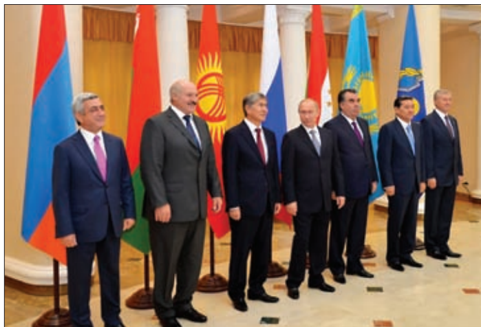
СОВМЕСТНОЕ ФОТОГРАФИРОВАНИЕ ГЛАВ ГОСУДАРСТВ – ЧЛЕНОВ ОРГАНИЗАЦИИ ПО ЗАВЕРШЕНИИ СЕССИИ СОВЕТА КОЛЛЕКТИВНОЙ БЕЗОПАСНОСТИ ОДКБ, 23 СЕНТЯБРЯ 2013 ГОДА, Г. СОЧИ

функционирующий в трех взаимоувязанных плоскостях: в сфере политического сотрудничества, в области обеспечения военной безопасности и противодействия вызовам и угрозам государствам-членам и организации в целом (рис. 1).