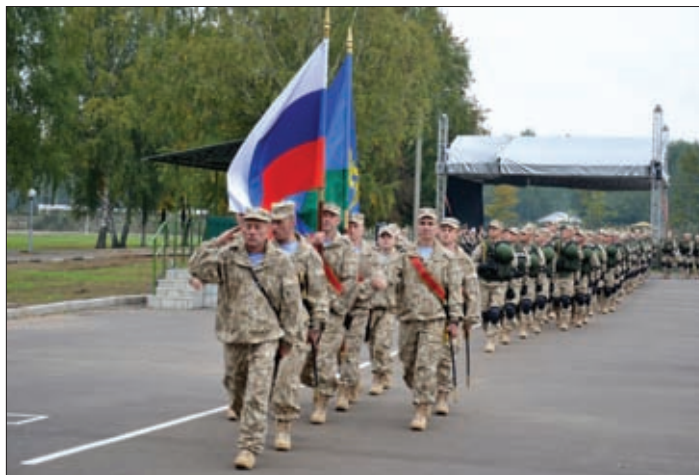
РОССИЙСКИЕ ДЕСАНТНИКИ – УЧАСТНИКИ СОВМЕСТНОГО УЧЕНИЯ С КОЛЛЕКТИВНЫМИ СИЛАМИ ОПЕРАТИВНОГО РЕАГИРОВАНИЯ ОДКБ «ВЗАИМОДЕЙСТВИЕ», СЕНТЯБРЬ 2013 ГОДА, РЕСПУБЛИКА БЕЛАРУСЬ

седневных мероприятий оперативной и боевой подготовки навыки апробируются в ходе регулярно проводимых учений с различными категориями формирований коллективных сил. Ежегодной традицией стало проведение на полигонной базе государств – членов ОДКБ совместных учений «Взаимодействие» с Коллективными силами оперативного реагирования (КСОР) ОДКБ (рис. 3), «Нерушимое братство» с миротворческими контингентами. Регулярно проводятся тактико-специальные учения «ГРОМ» с антинаркотическими подразделениями и «Кобальт» со спецподразделениями органов внутренних дел, включенных в состав КСОР ОДКБ. Впервые в 2013 году на территории Республики Казахстан проведено совместное учение спасательных подразделений государств-членов на базовом полигоне ОДКБ «Скальный город – Астана». Перечень и тематика проводимых в формате ОДКБ совместных мероприятий боевой подготовки из года в год расширяется и совершенствуется в соответствии с современными требованиями.