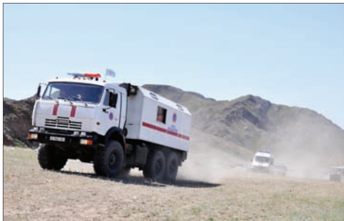
КАЗАХСТАНСКИЕ СПАСАТЕЛИ НА МАРШЕ. УЧЕНИЕ СПАСАТЕЛЬНЫХ ПОДРАЗДЕЛЕНИЙ ГОСУДАРСТВ – ЧЛЕНОВ ОДКБ ПО ОТРАБОТКЕ ДЕЙСТВИЙ ПРИ ЛИКВИДАЦИИ ПОСЛЕДСТВИЙ ЗЕМЛЕТРЯСЕНИЯ, МАЙ – ИЮНЬ 2013 ГОДА, РЕСПУБЛИКА КАЗАХСТАН

бре 2012 года одобрил комплекс мер, направленных на обеспечение безопасности и стабильности в государствах – членах организации в случае развития обстановки в Афганистане по негативному сценарию. В частности, запланированы дополнительные меры по укреплению вооруженных сил и правоохранительных органов Республики Таджикистан и Кыргызской Республики, повышению потенциальных возможностей Миротворческих сил и Коллективных сил оперативного реагирования ОДКБ, пресечению распространения нестабильности на территории государств – членов ОДКБ; совершенствованию взаимодействия государств – членов организации в интересах охраны внешних границ; применению созданного в ОДКБ механизма кризисного реагирования.