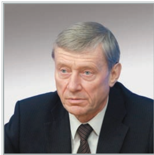
ГЕНЕРАЛЬНЫЙ СЕКРЕТАРЬ ОРГАНИЗАЦИИ ДОГОВОРА О КОЛЛЕКТИВНОЙ БЕЗОПАСНОСТИ Николай Николаевич Бордюжа

Организация Договора о коллективной безопасности (ОДКБ) берет свое начало с подписания в Ташкенте 15 мая 1992 года Договора о коллективной безопасности (ДКБ).