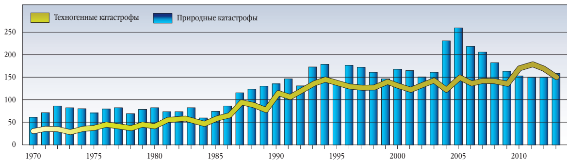
РОСТ КОЛИЧЕСТВА ТЕХНОГЕННЫХ И ПРИРОДНЫХ КАТАСТРОФ (1970–2013 ГОДЫ)