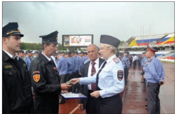
НАГРАЖДЕНИЕ ОТЛИЧИВШИХСЯ РАБОТНИКОВ ЧАСТНОЙ ОХРАННОЙ ОРГАНИЗАЦИИ В Г. РЯЗАНИ

Принятые меры в первом полугодии 2014 года позволили стабилизировать ситуацию, связанную с неправомерным использованием зарегистрированного оружия: количество таких преступлений снизилось на 2,3% – до 217 случаев; их доля от общего числа зафиксированных преступлений, совершенных с применением огнестрельного оружия (1130), составила 16,9%.