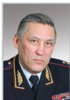
НАЧАЛЬНИК ГУОООП МВД РОССИИ ГЕНЕРАЛ-ЛЕЙТЕНАНТ ПОЛИЦИИ Юрий Константинович Валяев

Президентом Российской Федерации неоднократно указывалось на новые приоритеты в деятельности органов внутренних дел в условиях принятого законодательства о полиции, реформирования МВД России.